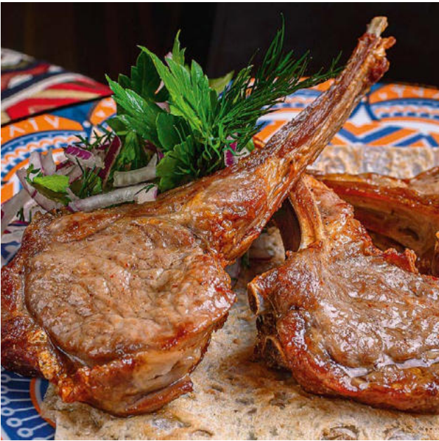
Корейка баранины 200 / 70 г. 1200 ₺ Mutton lion