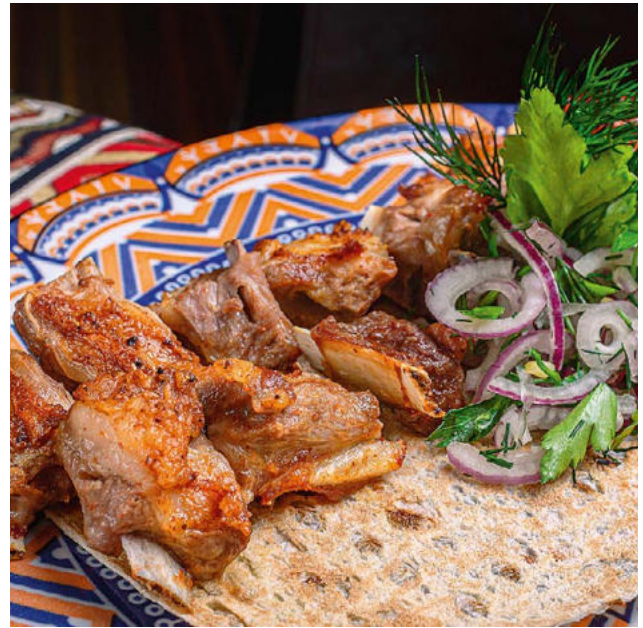
Семечки из телятины 180 / 70 г. 660 ₺ Semechki grilled veal