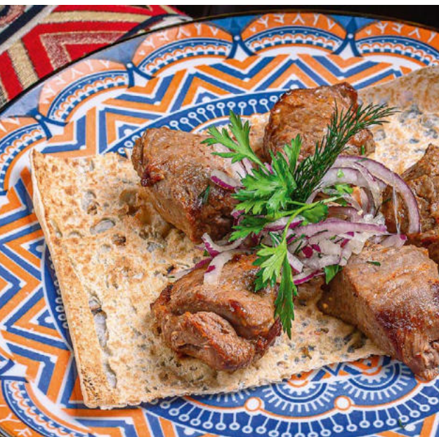
Семечки из баранины 180 / 70 г. 680 ₺ Semechki grilled lamb