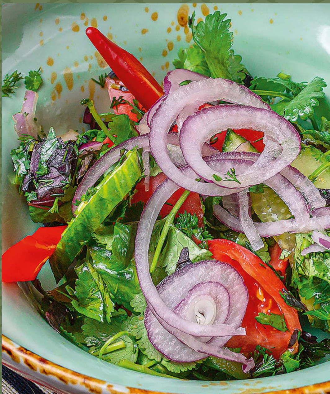
Овощной салат по-грузински