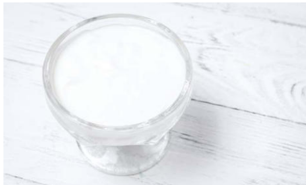
Сметана Sour cream