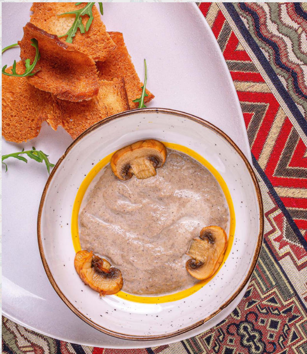
Крем-суп из шампиньонов / из картофеля с шампиньонами , луком и сливками /