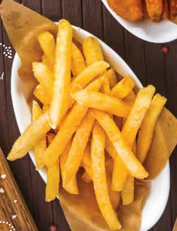
Картофель фри 150 г