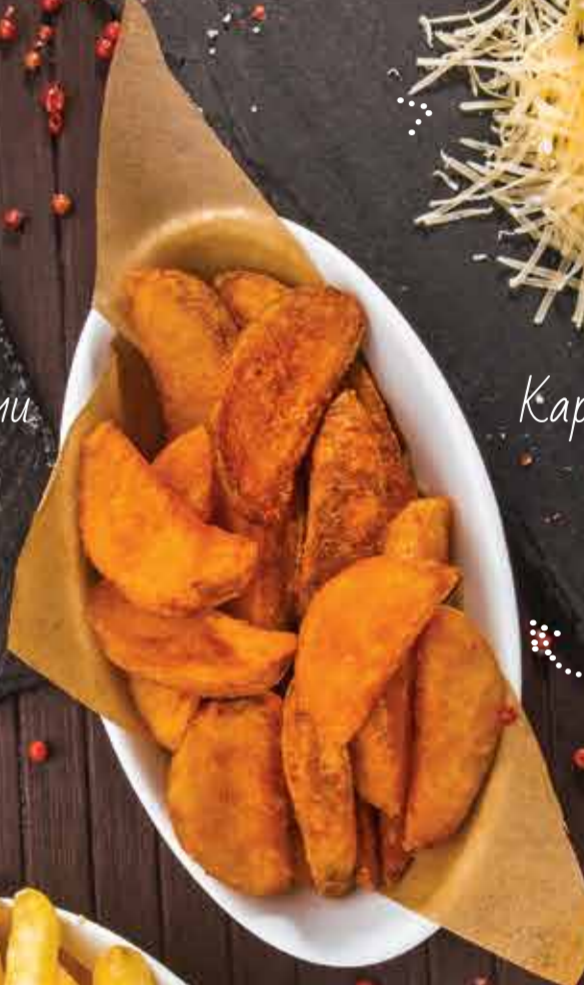
Картофель по-деревенски 200 г