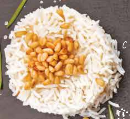
Пряный рис с кедровыми орешками 150 г