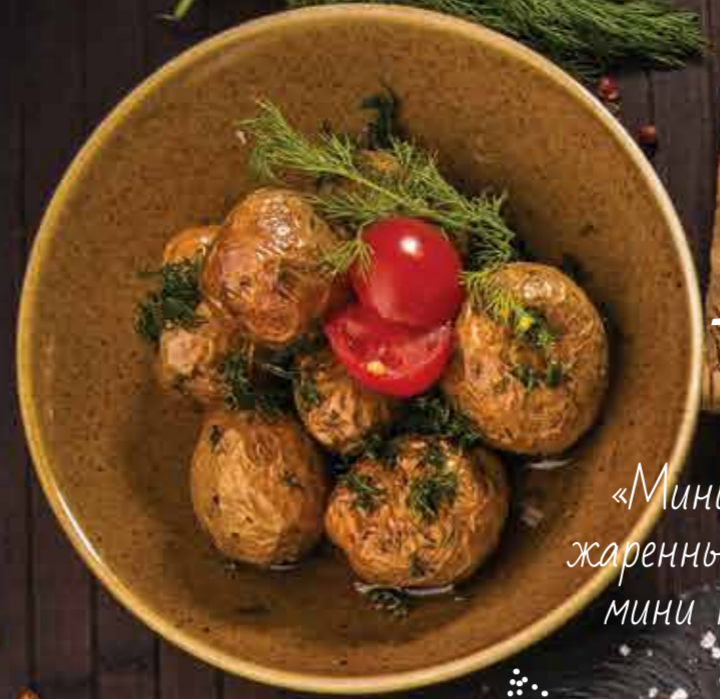
«Мини батата» жаренный на углях мини картофель 200 г