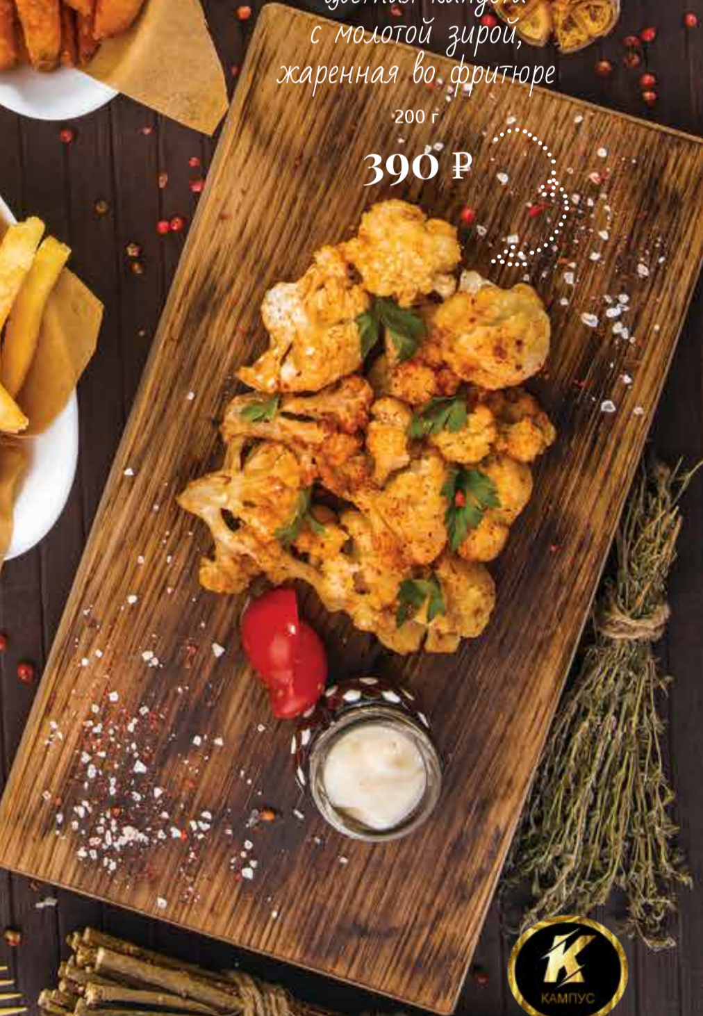
«Захра» цветная капуста с молотой зирой, жаренная во фритюре 200 г