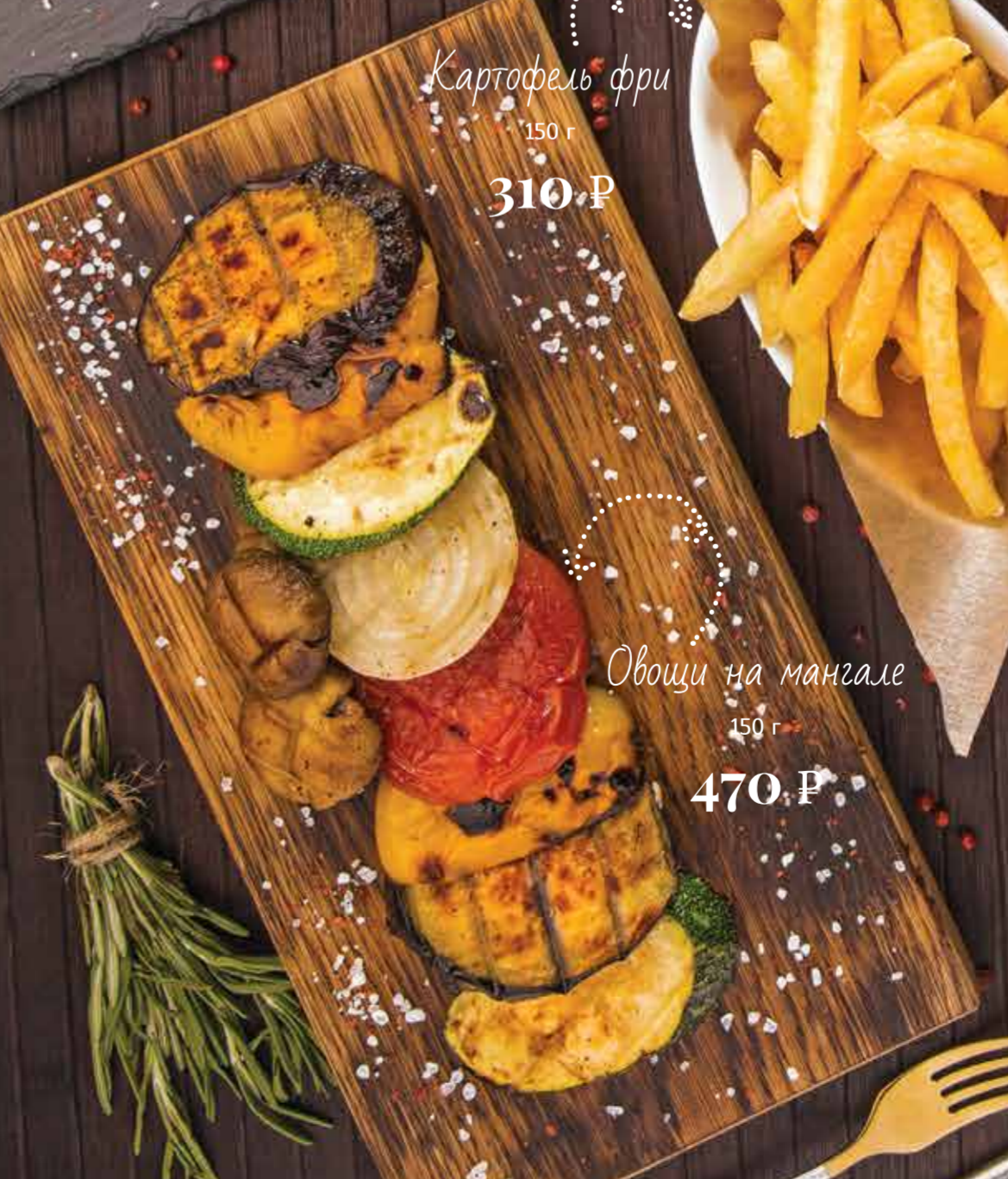
Овощи на мангале 150 г