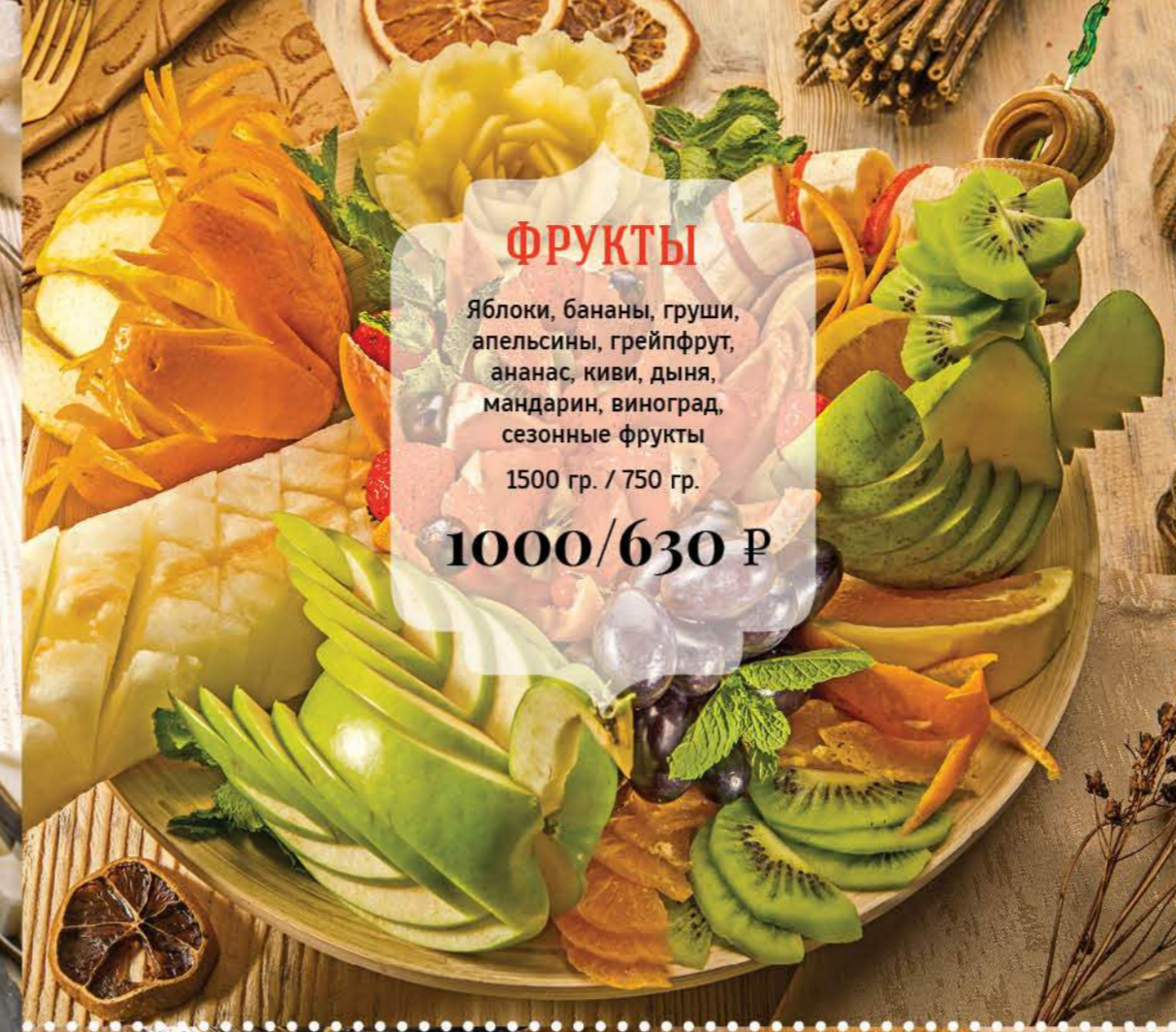
ФРУКТЫ Яблоки, бананы, груши, апельсины, грейпфрут, ананас, киви, дыня, мандарин, виноград, сезонные фрукты 1500 гр. / 750 гр. 1000/630 Р