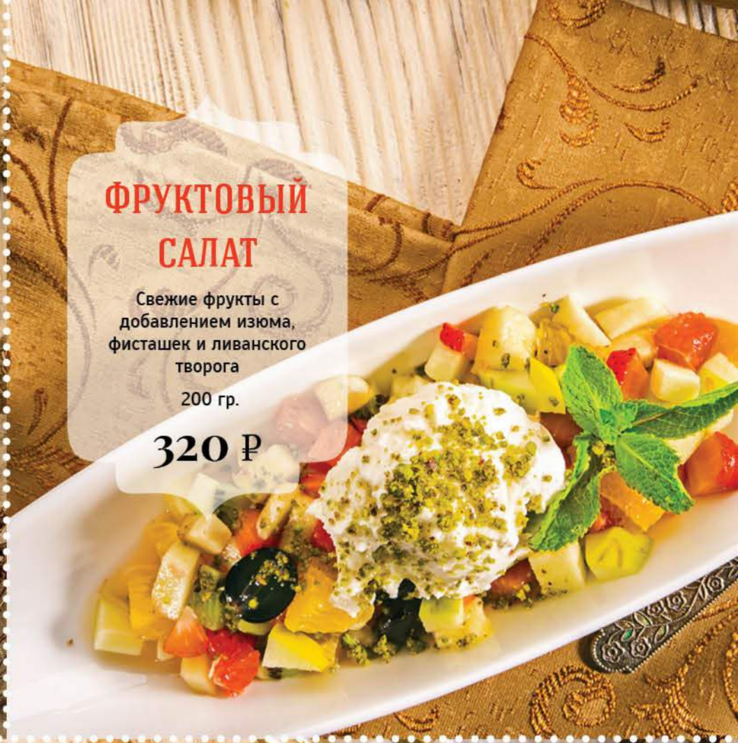
ФРУКТОВЫЙ САЛАТ Свежие фрукты с добавлением изюма, фисташек и ливанского творога 200 гр. 320 Р