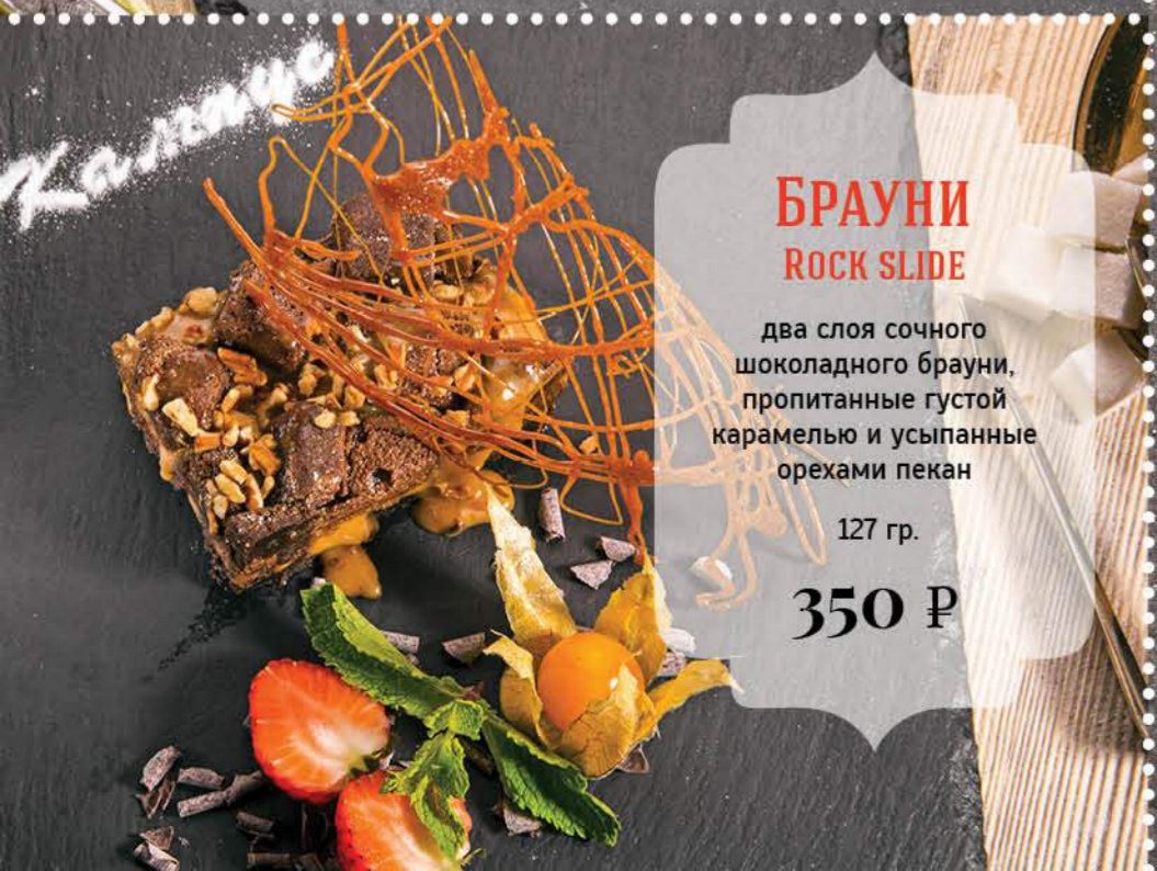
БРАУНИ ROCK SLIDE два слоя сочного шоколадного брауни, пропитанные густой карамелью и усыпанные орехами пекан 127 гр. 350 Р