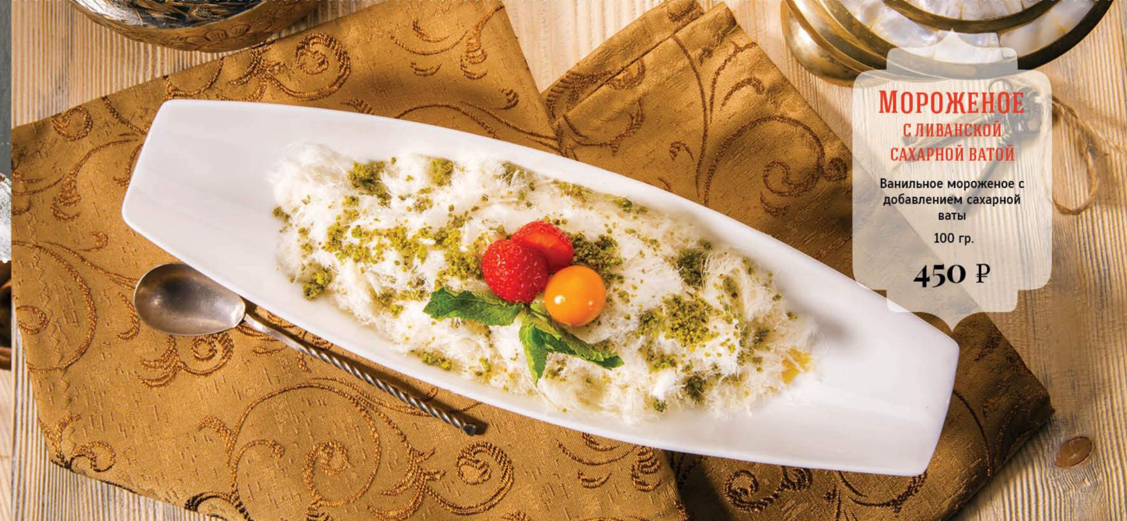
МОРОЖЕНОЕ С ЛИВАНСКОЙ САХАРНОЙ ВАТОЙ Ванильное мороженое с добавлением сахарной ваты 100 гр. 450 Р