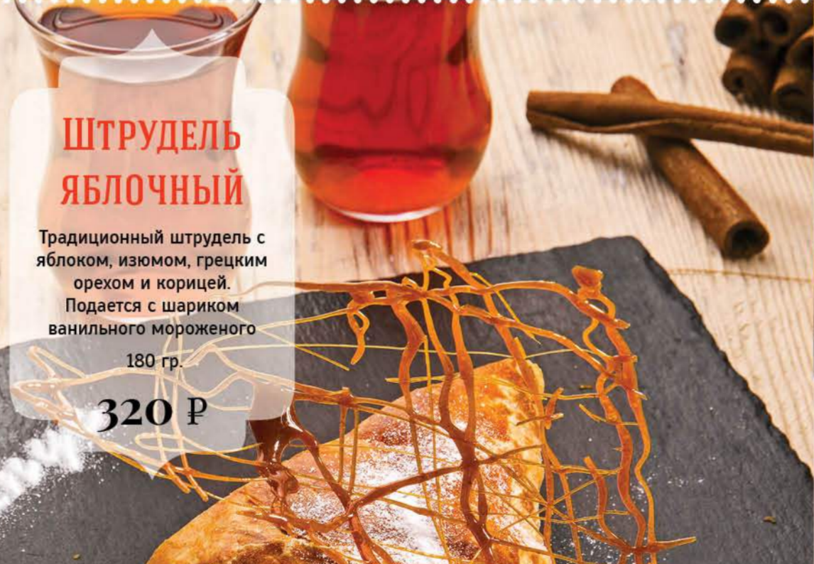
ШТРУДЕЛЬ ЯБЛОЧНЫЙ Традиционный штрудель с яблоком, изюмом, грецким орехом и корицей. Подается с шариком ванильного мороженого 180 гр. 320 Р