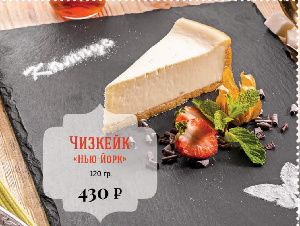
ЧИЗКЕЙК «НЬЮ-ЙОРК» 120 гр. 430 Р