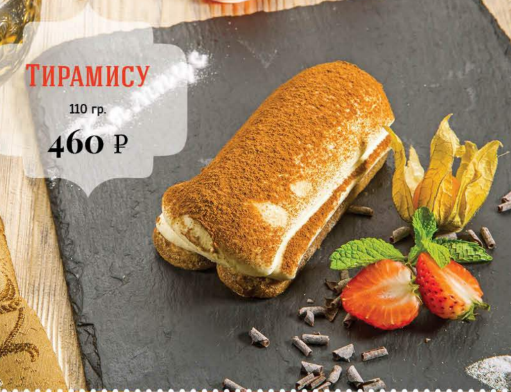
ТИРАМИСУ 110 гр. 460 Р