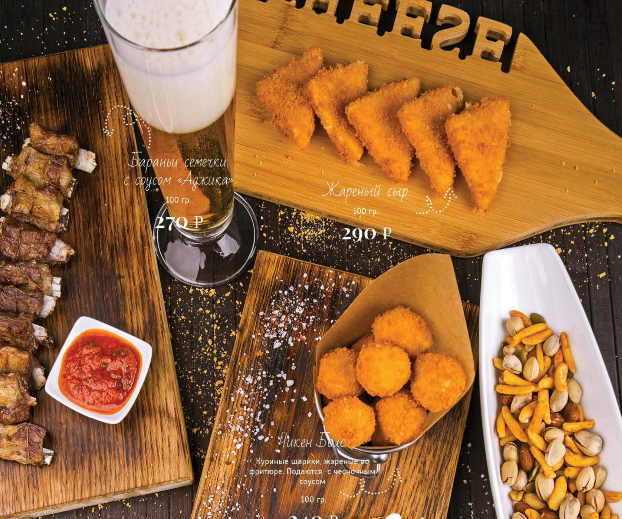
Бараны семечки с соусом «Аджика» 100 гр. 270 Р