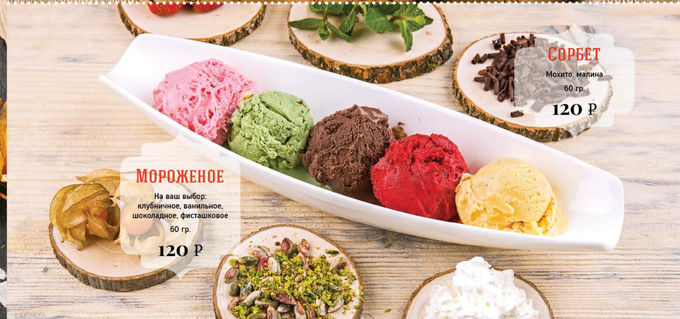
МОРОЖЕНОЕ На ваш выбор: клубничное, ванильное, шоколадное, фисташковое 60 гр. 120 Р