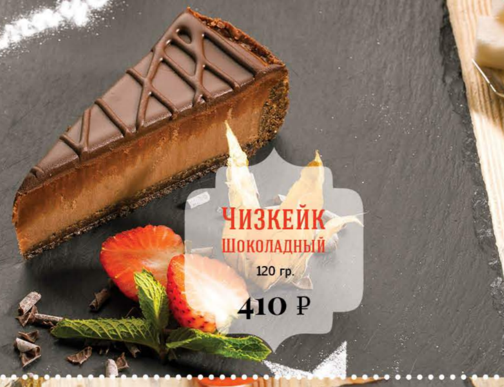
ЧИЗКЕЙК ШОКОЛАДНЫЙ 120 гр. 410 Р