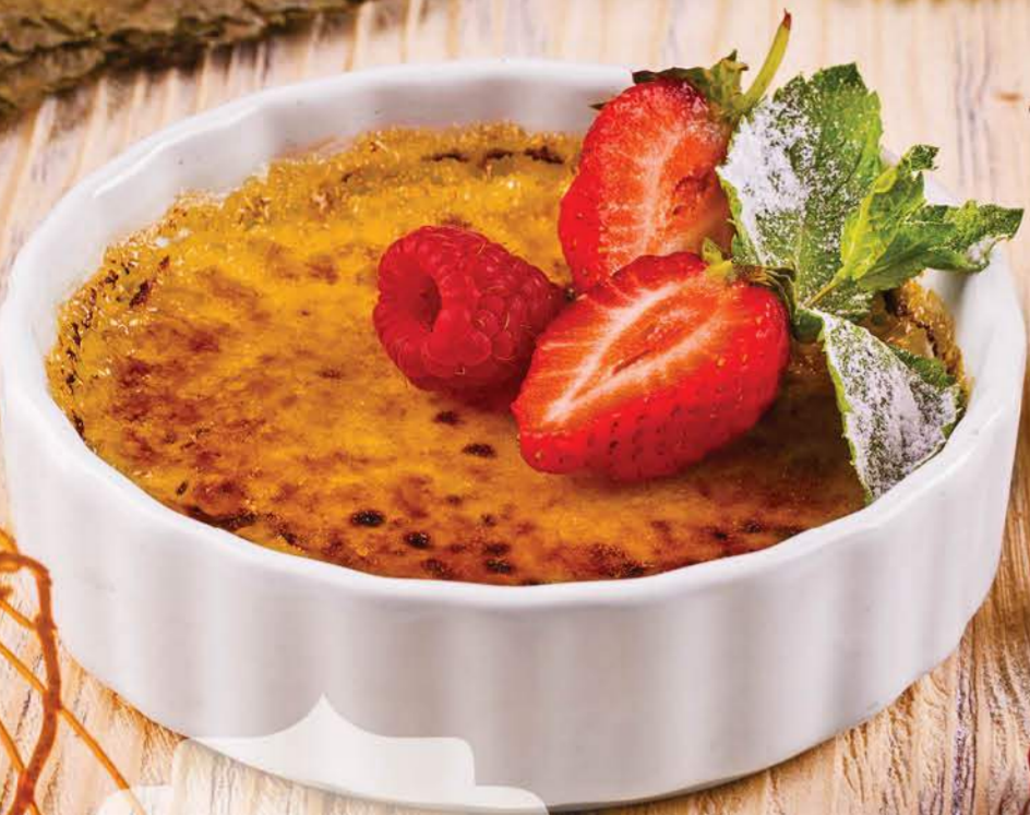
КРЕМ-БРЮЛЕ Знаменитый французский десерт на основе сливок с «подожженной» сахарной корочкой 120 гр. 300 Р