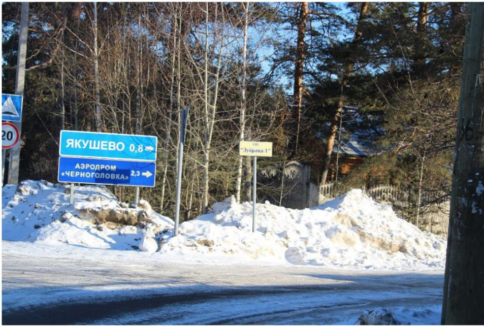
Мимо Якушево едим прямо в сторону Аэродрома