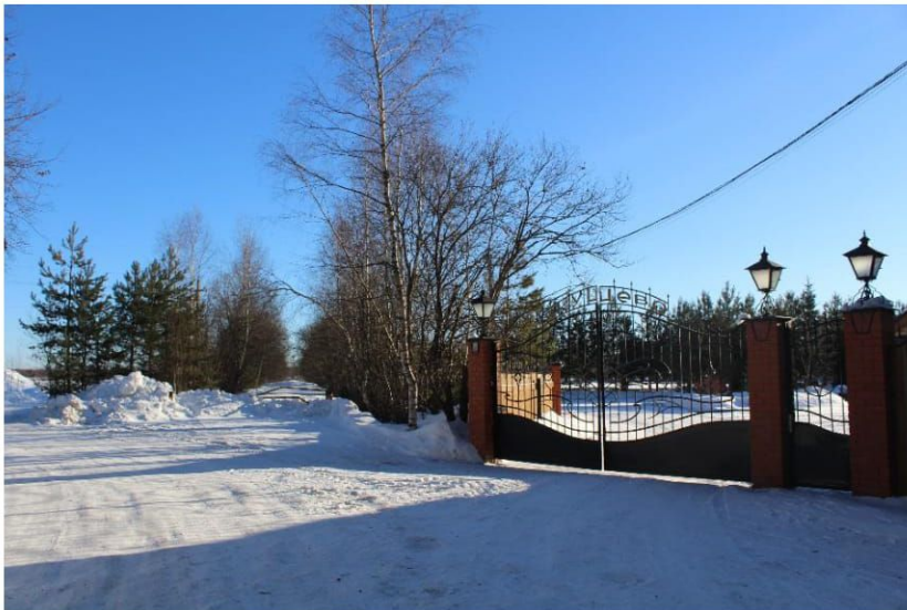
Не поворачивая на Аэродром едим к пейнтбольному клубу Передовая 2.0 на стоянку.