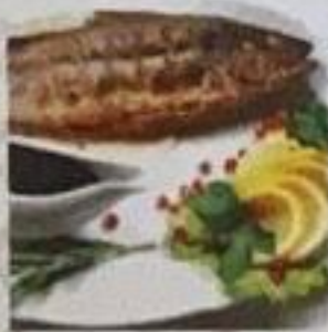
Сибас на углях 300 гр 320 ккал 650 р.