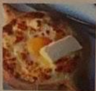
Хачапури по-аджарски 250 гр 990 ккал 420 р.