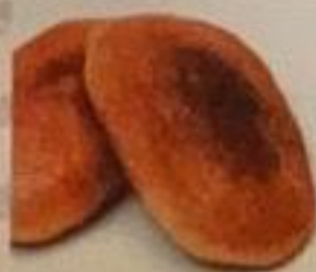
Мчади (лепешка из кукурузной муки) 2 шт / 120гр. 510 ккал 150 р.