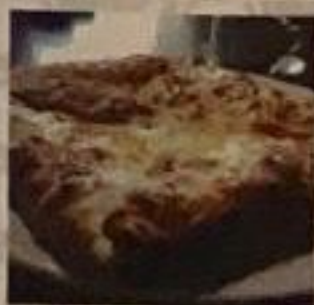
Хачапури слоеный 420гр. 920 ккал 550 р.