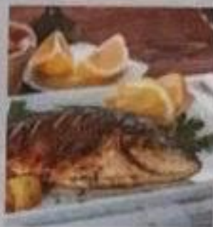
Дорадо Подается в кисло-сладком соусе 50/300 гр 260 ккал 650 р.