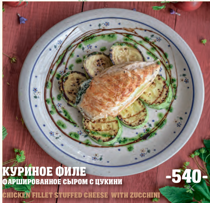
КУРИНОЕ ФИЛЕ ФАРШИРОВАННОЕ СЫРОМ С ЦУКНИНИ CHICKEN FILLET STUFFED CHEESE WITH ZUCCHINI