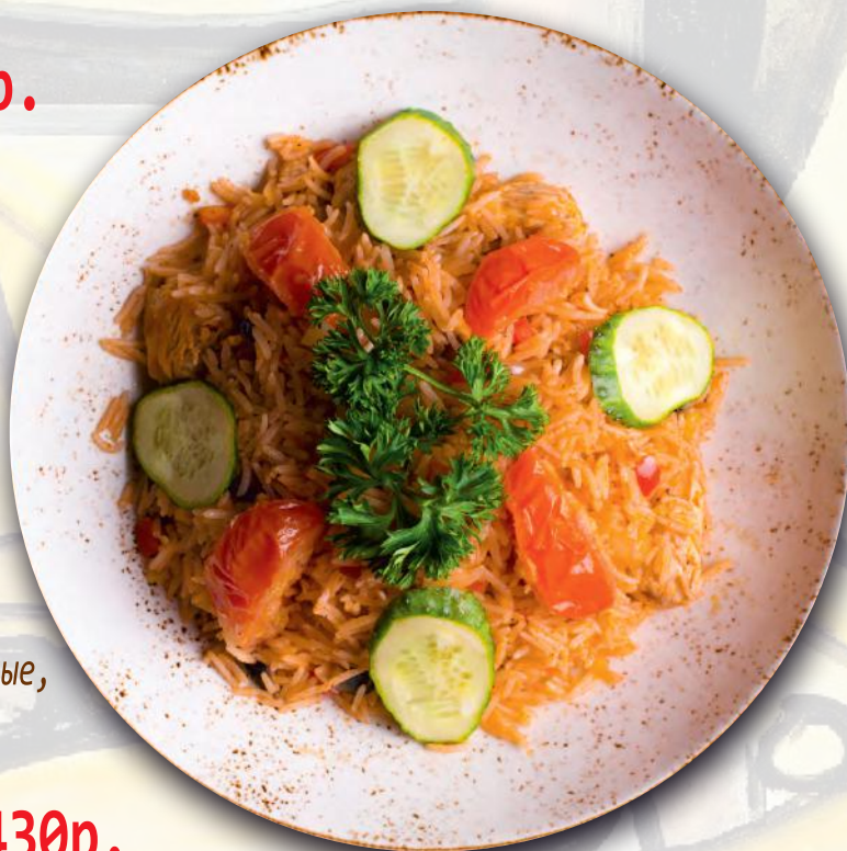
Рис «пряный» (350гр.)

(Рис, морепродукты, куриная грудка, лук, болгарский перец, орегано, белое сухое вино, сыр «Пармезан»)