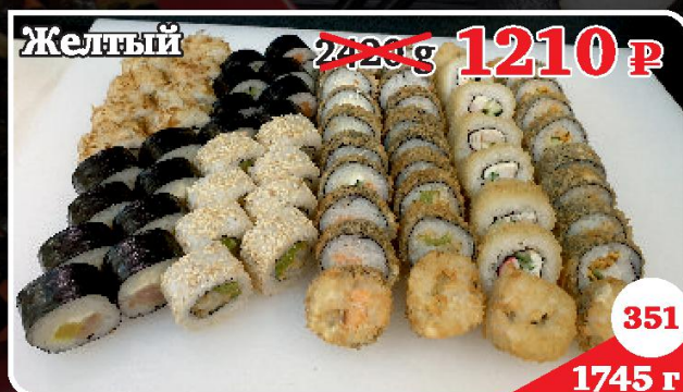
Инь-Янь, Бонито, Ролл Яркий, Апачи, Токио Темпура, Тахара Темпура, Аригато Темпура, Сей Темпура