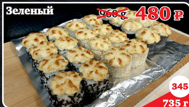
Сохо, Нишики, Ямакиси