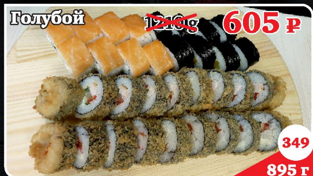
Филадельфия Лайт, Инь-Янь, Нику Темпура, Дайсен Темпура