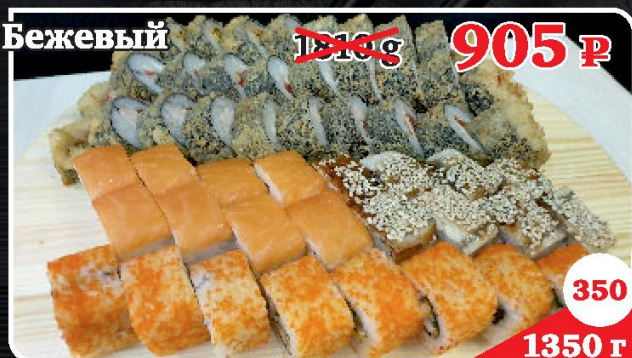
Нежный, Унаги Чиз, Оками, Унаги Темпура, Окава Темпура, Кай Темпура