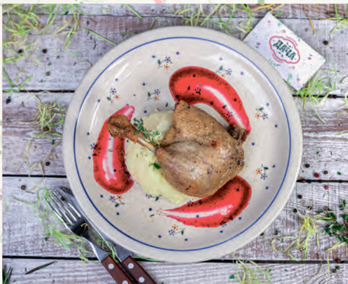
УТИНАЯ НОЖКА ПОДАЕТСЯ С КАРТОФЕЛЬНЫМ ПЮРЕ DUCK LEG WITH MASHED POTATOES