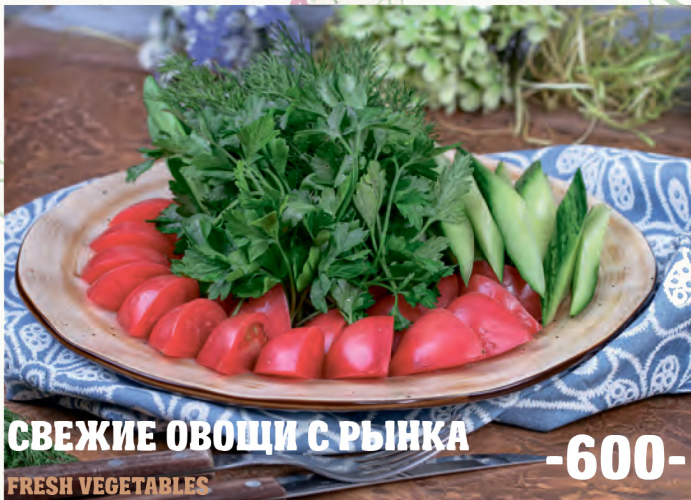
СВЕЖИЕ ОВОЩИ С РЫНКА