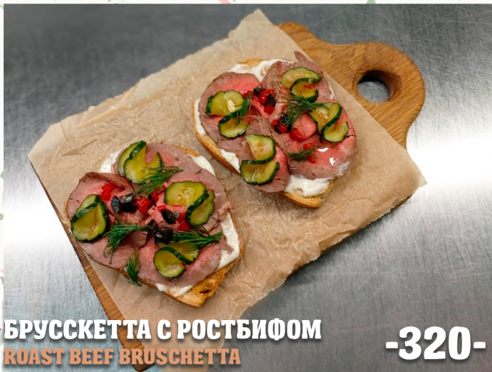
БРУСКЕТТА С РОСТБИФОМ ROAST BEEF BRUSCHETTA