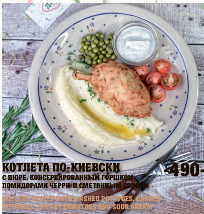
КОТЛЕТКА ПО-КИЕВСКИ С ПЮРЕ, КОНСЕРВИРОВАННЫМ ГОРШКОМ ПОМИДОРАМИ ЧЕРРИ И СМЕТАННЫМ СОУСОМ CUTLETS IN KIEV WITH MASHED POTATOES, CANNED POTATOES, CHERRY TOMATOES AND SOUR CREAM