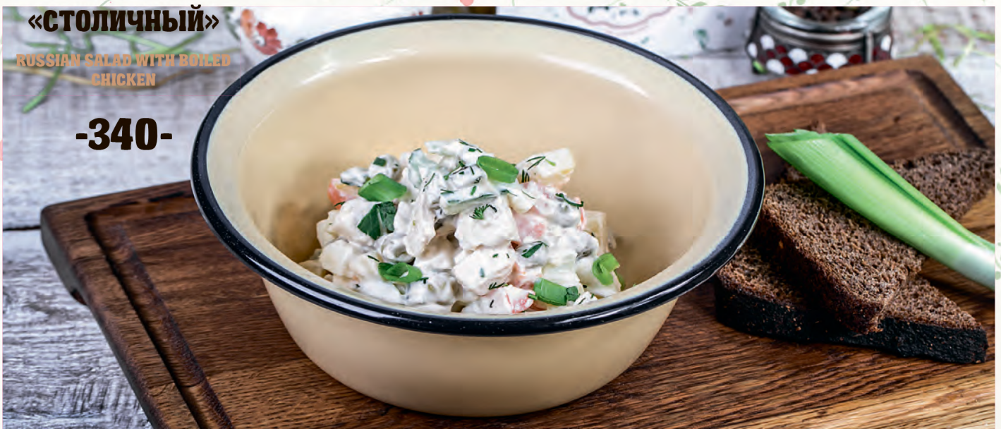
«СТОЛИЧНЫЙ» RUSSIAN SALAD WITH BOILED CHICKEN