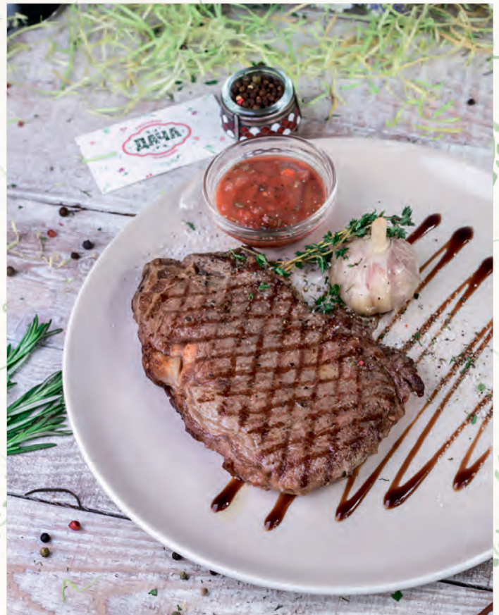
СТЕЙК NEW YORK -1100- С ПРЯНЫМ СОУСОМ NEW YORK STEAK WITH SPICY SAUCE