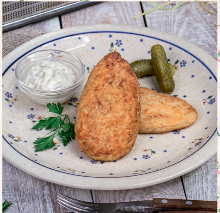
КОТЛЕТЫ «ПЕТЕРБУРЖСКИЕ» С СЕВЕРНОЙ РЫБЫ С СОУСОМ ТАР-ТАР ЖАРЕНЬИЕ/ НА ПАРУ CUTLETS «PETERSBURG» WITH NORTHERN FISH WITH TAR-TAR SAUCE