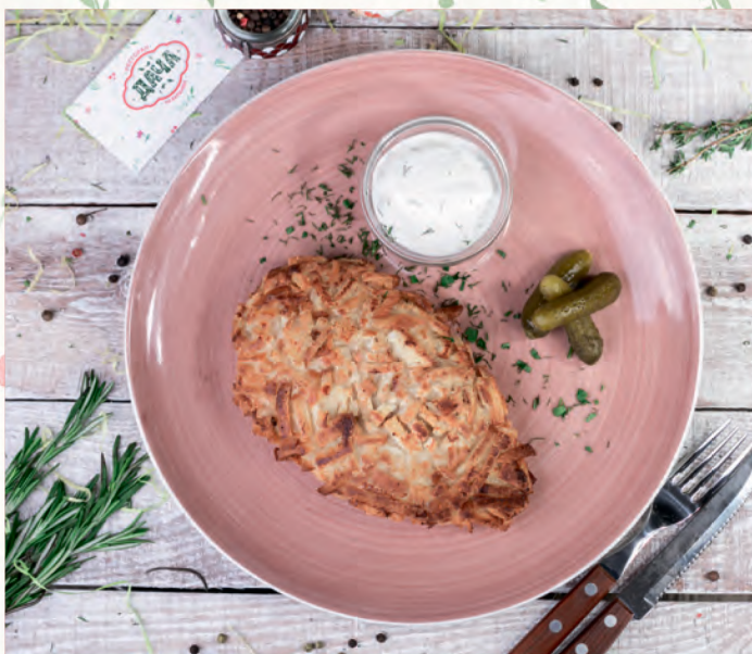
КОТЛЕТКА «ПОЖАРСКАЯ» СО СМЕТАННЫМ СОУСОМ CUTLET «POZHARSKAYA» WITH GARLIC SAUCE