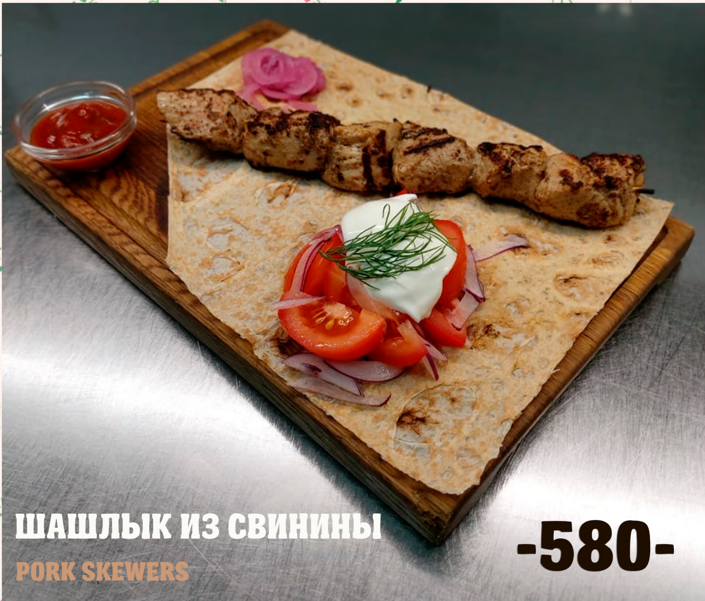
ШАШЛЫК ИЗ СВИНИНЫ PORK SKEWERS