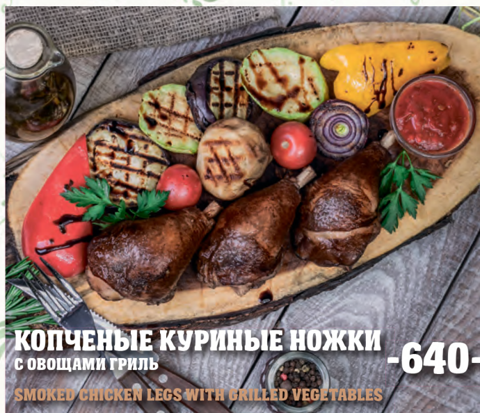
КОПЧЕНЫЕ КУРИНЫЕ НОЖКИ С ОВОЩАМИ ГРИЛЬ SMOKED CHICKEN LEGS WITH GRILLED VEGETABLES