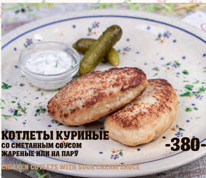
КОТЛЕТЫ КУРИНЫЕ СО СМЕТАННЫМ СОУСОМ ЖАРЕНЬЕ ИЛИ НА ПАРУ CHICKEN CUTLETS WITH SOUR CREAM SAUCE