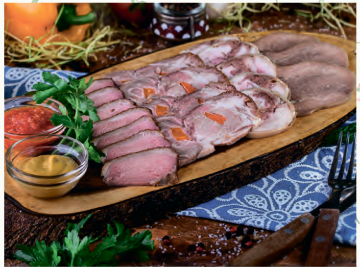
МЯСНОЕ АССОРТИ УТИНАЯ ГРУДКА, БУЖЕНИНА, КУРИНЫЙ РУЛЕТ, ЯЗЫК ГОВЯЖИЙ, ПОДАЕТСЯ С АДЖИКОЙ И ГОРЧИЦЕЙ