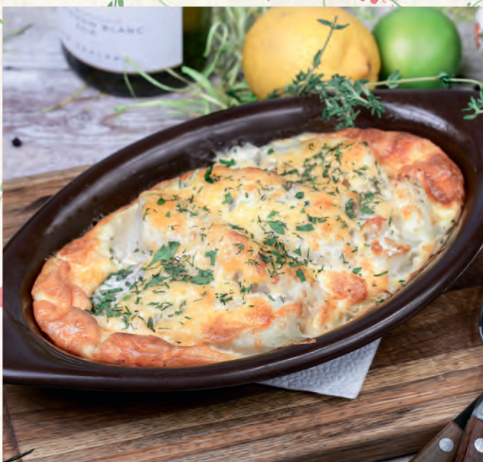
РЫБА ПО-РУССКИ ЗАПЕЧЕНАЯ ТРЕСКА С КАРТОФЕЛЕМ В СЛИВКАХ FISH IN RUSSIAN BAKED WITH POTATOES IN CREAM