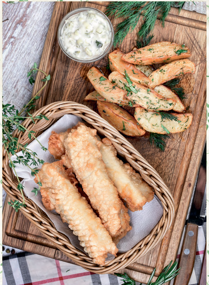
ТРЕСКА В ПИВНОМ КЛЯРЕ С КАРТОФЕЛЕМ ПО-ДЕРЕВЕНСКИ И СОУСОМ ТАР-ТАР COD IN BEER BATTER WITH POTATOES IN A COUNTRY STYLE AND TAR-TAR SAUCE