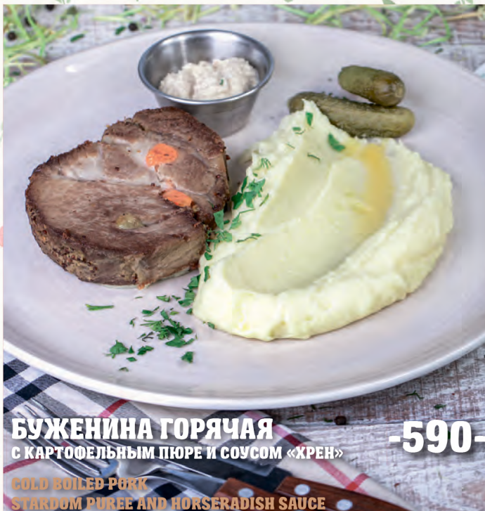
БУЖЕНИНА ГОРЯЧАЯ -590- С КАРТОФЕЛЬНЫМ ПЮРЕ И СОУСОМ «ХРЕН» COLD BOILED PORK STARDOM PUREE AND HORSE RADISH SAUCE