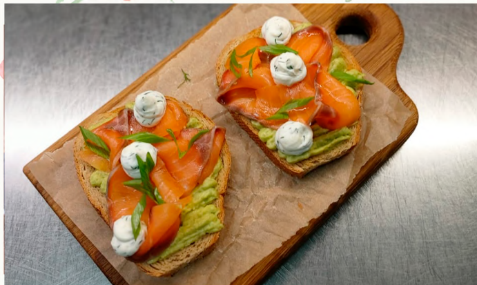
БРУСКЕТТА С ЛОСОСЕМ BRUSCHETTA WITH SALMON

SET OF SMOKED FISH TROUT, SALMON, PIKE, SQUID, HALIBUT