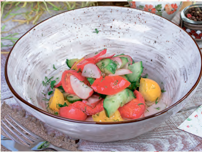
ОВОЩНОЙ С ЗАПРАВКОЙ НА ВЫБОР-СМЕТАНА, МАЙОНЕЗ, АРОМАТНОЕ МАСЛО VEGETABLE SALAD WITH DRESSING FOR CHOICE-SOUR CREAM, MAYONNAISE, FRAGRANT OIL