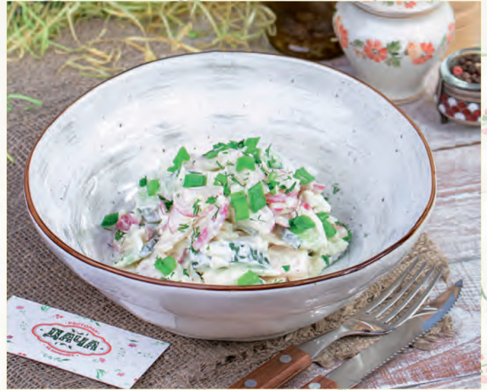
«ДАЧНЫЙ» ОГУРЦЫ, РЕДИС, ЯЙЦО, ЗЕЛЕНЬ ЛУК, СМЕТАНА CUCUMBER, RADISH, EGG, GREEN ONION, SOUR CREAM