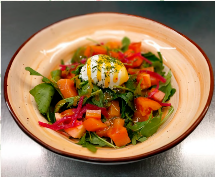
САЛАТ С ЛОСОСЕМ И СОУСОМ ВИНЕГАР SALAD WITH SALMON AND VINEGAR SAUCE