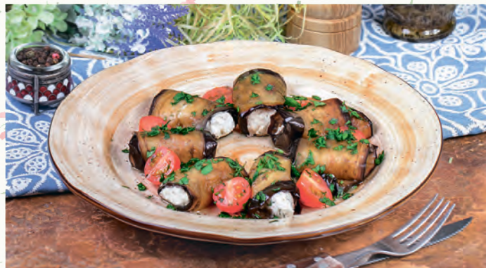
РУЛЕТКИ ИЗ БАКЛАЖАН С СЫРНОЙ НАЧИНКОЙ

COLD CUTS - DUCK BREAST, COLD BOILED PORK, CHICKEN ROLL, TONGUE BEEF, SERVED WITH ADZHIKA AND MUSTARD