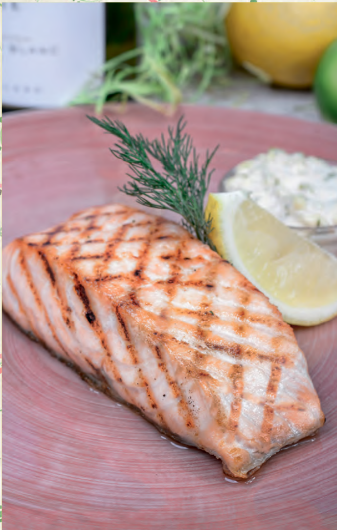
СТЕЙК ИЗ ЛОСОСЯ С СОУСОМ ТАР-ТАР ЖАРЕНЬИ/НА ПАРУ/КОПЧЕНЫЙ SALMON STEAK WITH TAR-TAR SAUCE