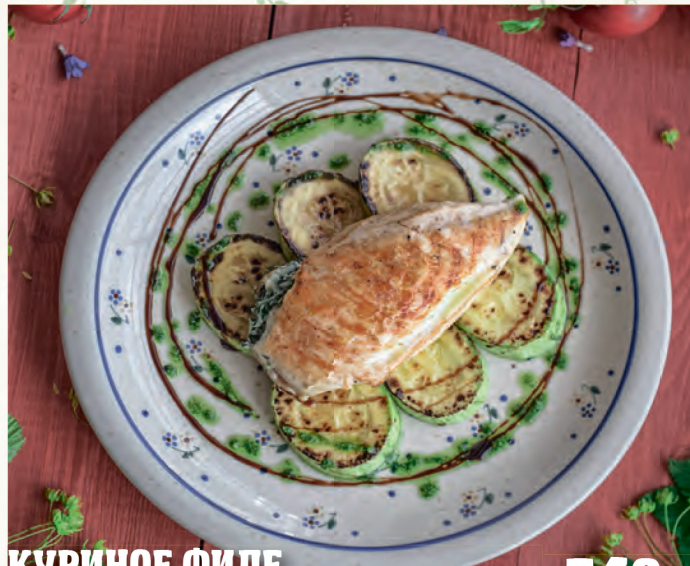
КУРИНОЕ ФИЛЕ ФАРШИРОВАННОЕ СЫРОМ С ЦУКНИНИ CHICKEN FILLET STUFFED CHEESE WITH ZUCCHINI