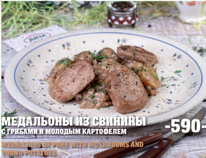
МЕДАЛЬОНЫ ИЗ СВИНИНЫ -590- С ГРИБАМИ И МОЛОДЫМ КАРТОФЕЛЕМ MEDALLIONS OF PORK WITH MUSHROOMS AND YOUNG POTATOES