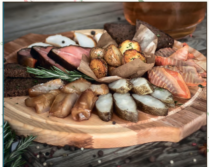
СЕТ ИЗ КОПЧЕНОЙ РЫБЫ ФОРЕЛЬ, ЛОСОСЬ, ЩУКА, КАЛЬМАР, ПАЛТУС