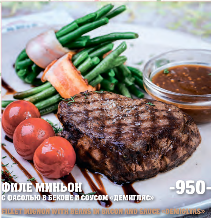
ФИЛЕ МИНЬОН -950- С ФАСОЛЬЮ В БЕКОНЕ И СОУСОМ «ДЕМИГЛАС» FILLET MIGNON WITH BEANS IN BACON AND SAUCE «DEMIGLAS»