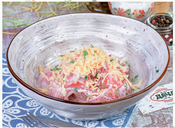
ПОМИДОРЫ СО СМЕТАНОЙ И СЫРОМ TOMATOES WITH SOUR CREAM AND CHEESE