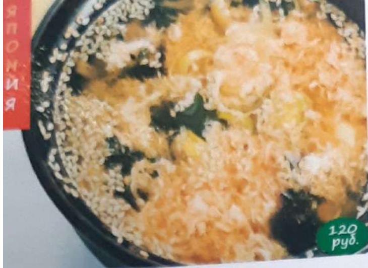
Суп "Ким чи" 300 гр. (Ким чи соус, кунжут, лук порей, водоросли вакаме, яйцо)