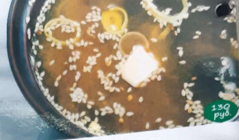
Суп "Мисо" 300 гр. (мисо паста, лук порей, кунжут, водоросли вакаме)