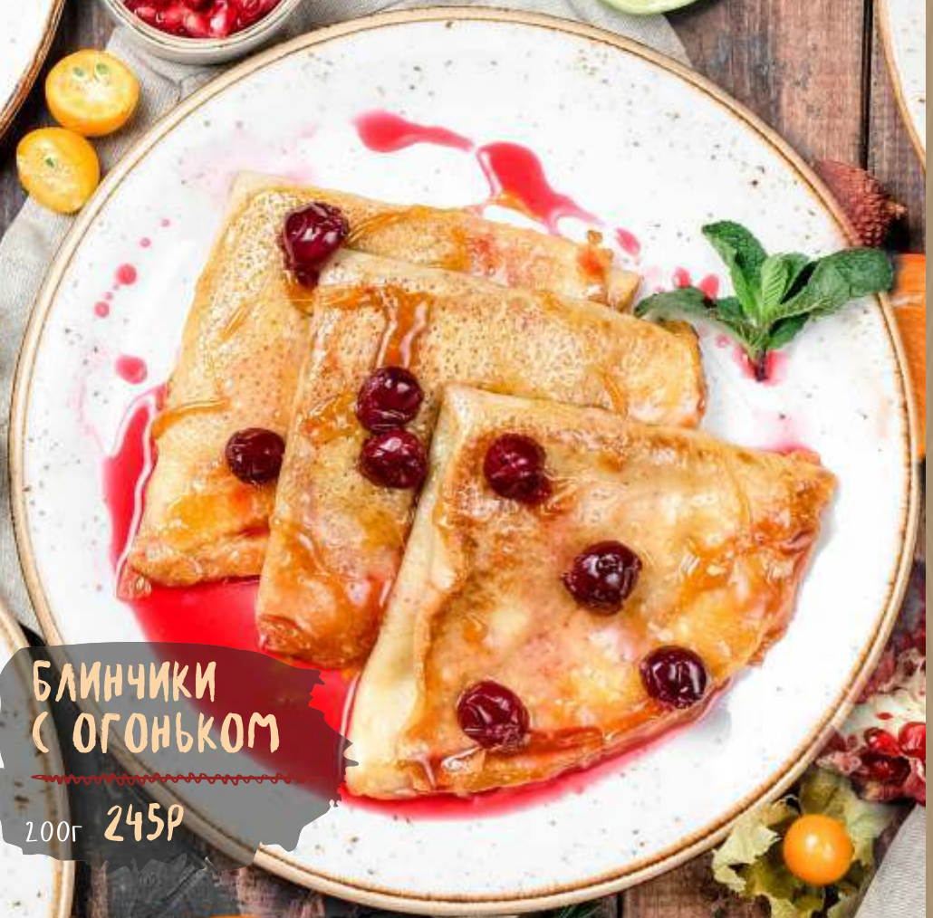
БЛИНЧИКИ С ОГОНЬКОМ