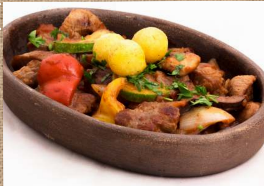
Телятина с овощами