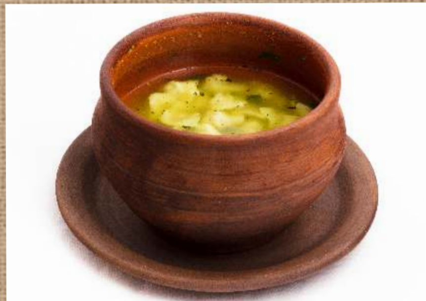
Дюшбара восточный суп с пельменями Dushbara (soup with small dumplings)