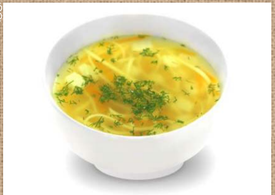
Куриный суп с домашней лапшой Chicken soup with home made noodles