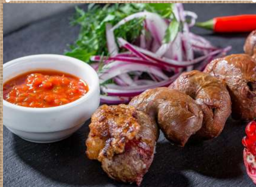
Шашлык из бараньих почек Mutton kidneys Shashlik 250гр. 300 P