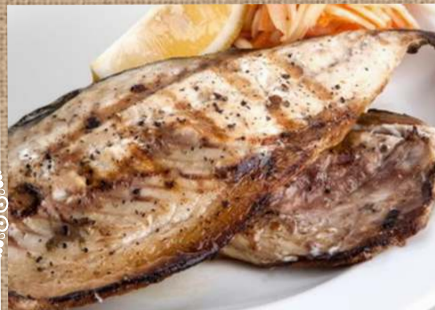
Скумбрия на гриле