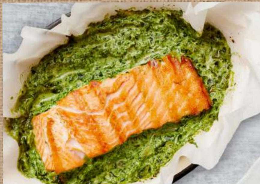
Лосось со шпинатом в фольге