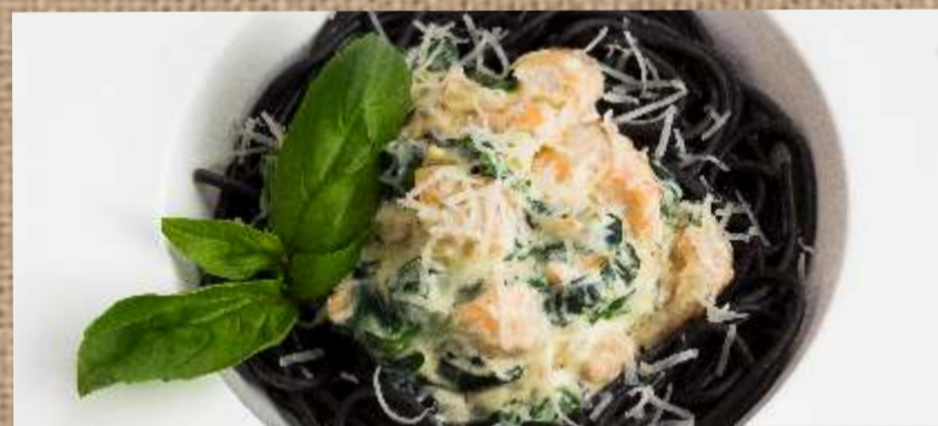
Черные спагетти с лососем со шпинатом

Black Spaghetti with Salmon with Spinach