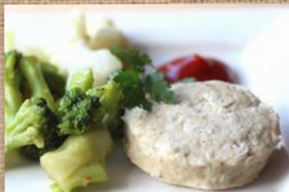
Куриные котлеты на пару