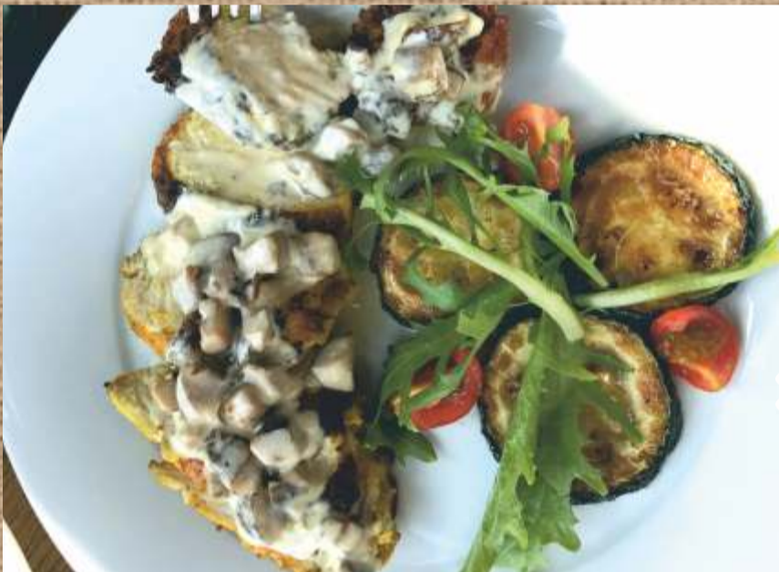
Куриное филе с жульеном из грибов в сливочном соусе с жареными цукини 320 P Chicken fillet with mushroom julienne in a creamy sauce with roasted zucchini 300гр.