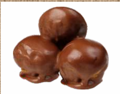
Профитроли в шоколадном соусе Profiteroles