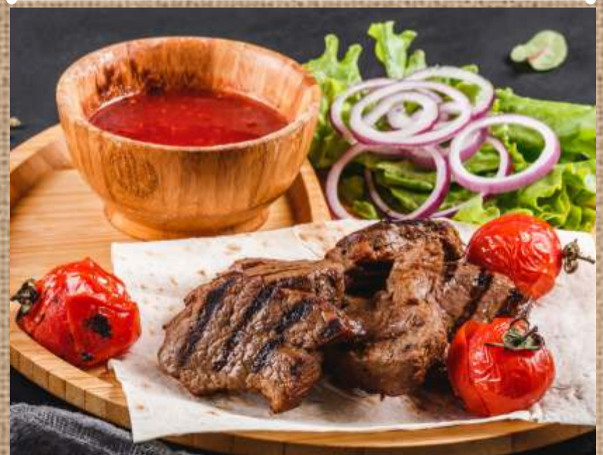
Шашлык из говяжьей вырезки