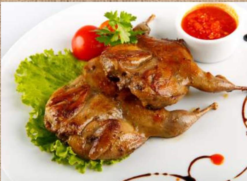
Перепелка на гриле 550 P Quail on the grill 2шт./30гр.