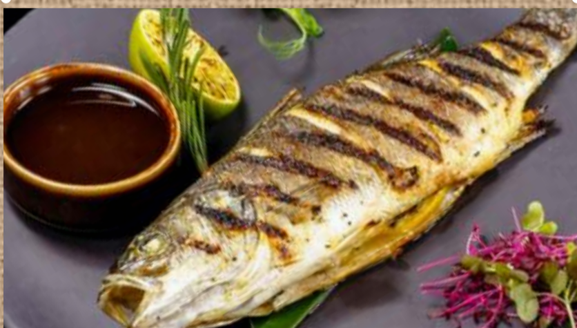
Сибас на гриле Grilled seabass