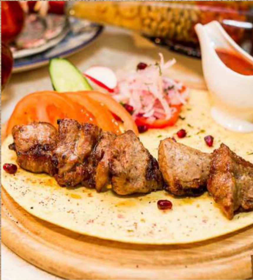
Шашлык из свиной шейки Pork neck shashlik