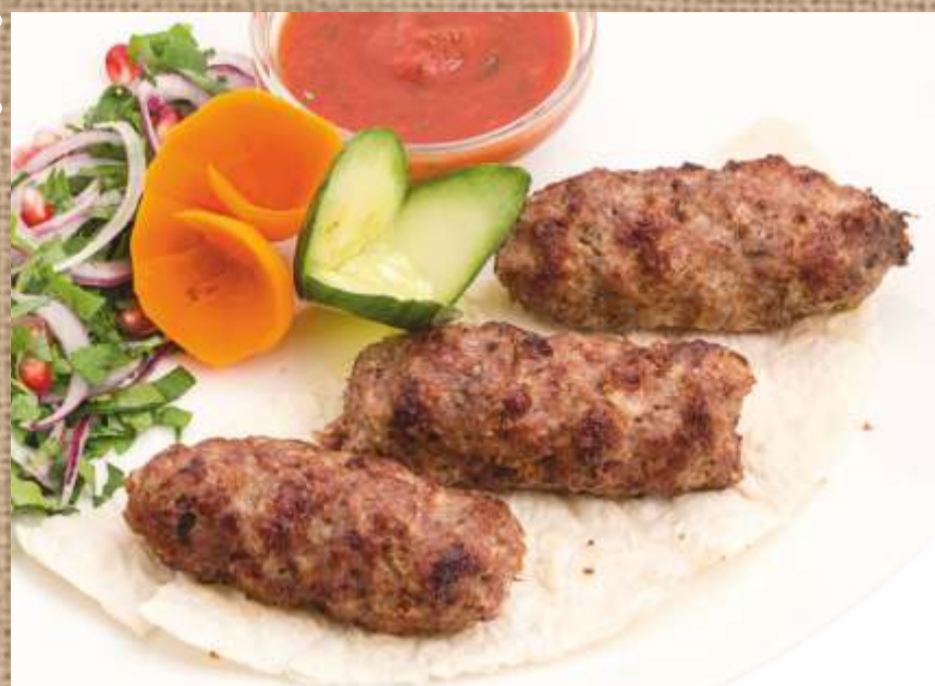
Люля-кебаб из ягненка Lamb lulya-kebab 250гр. 360 P