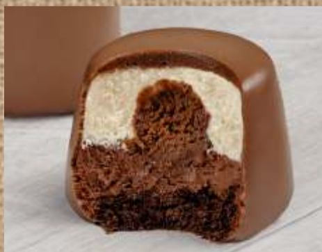
Шоколадный фондан Chocolate Fondant