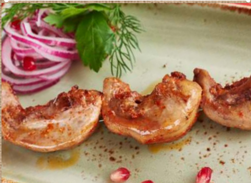
Язык ягненка на мангале Lamb tongue on the grill 250гр. 320 P