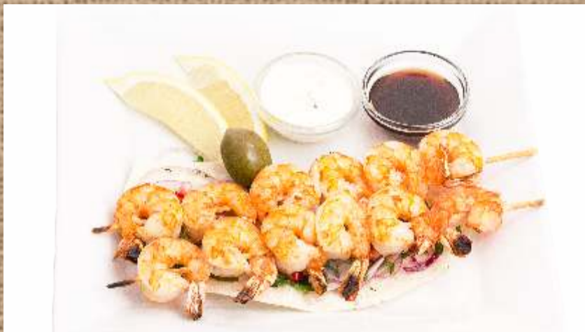
Шашлык из креветок Prawns Shashlik