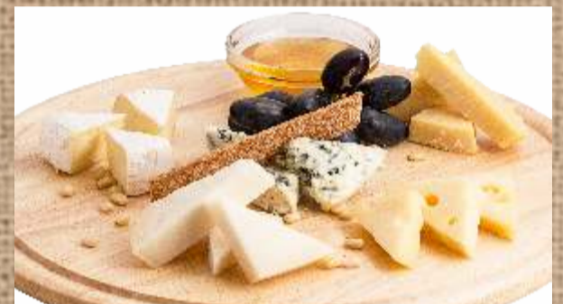
Европейские сыры с медом и кедровым орехом Assorted European Cheeses