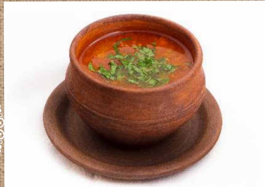
Харчо из телятины Caucasian soup Kharcho with veal