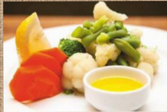
Овощи на пару