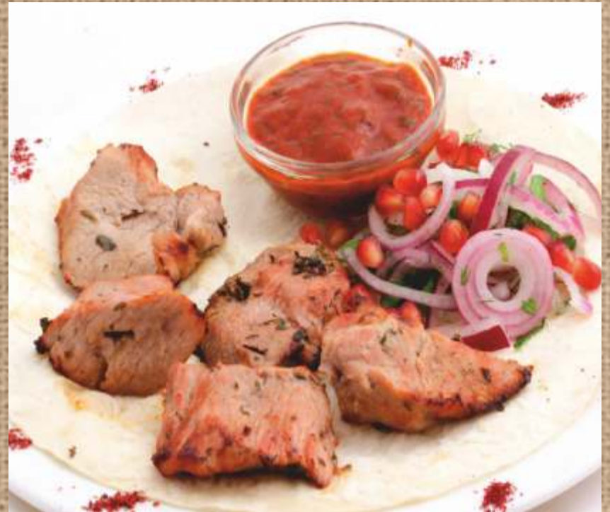
Шашлык из мякоти телятины