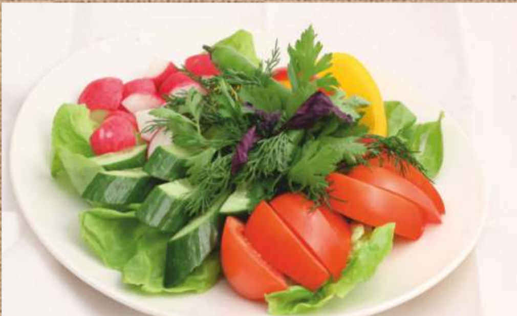
Свежие овощи с зеленью свежие помидоры, огурцы, ассорти зелени, редис Fresh vegetables with greens