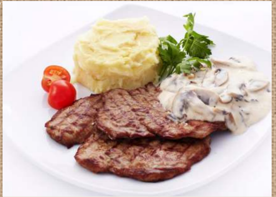
Лангет из говядины 600 P Beef Langet 180/150гр.