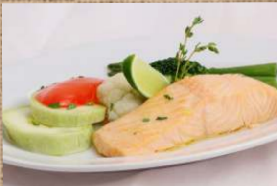
Лосось с овощами на пару