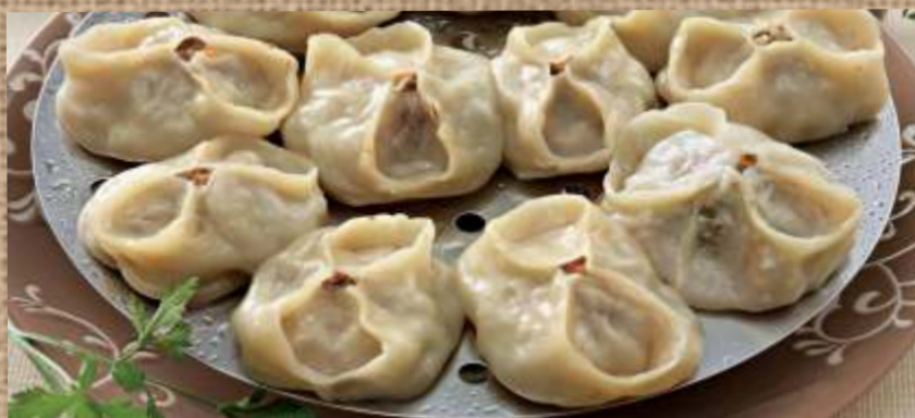
Манты из баранины