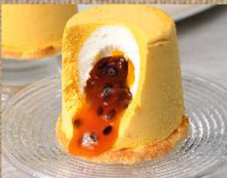
Манго-маракуйя Mango - passion fruit