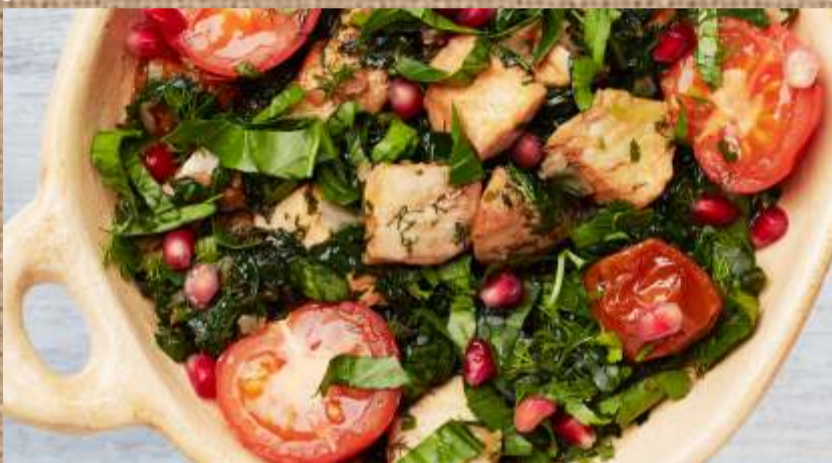
Сырдак из судака Syrdak (zander in oriental style)