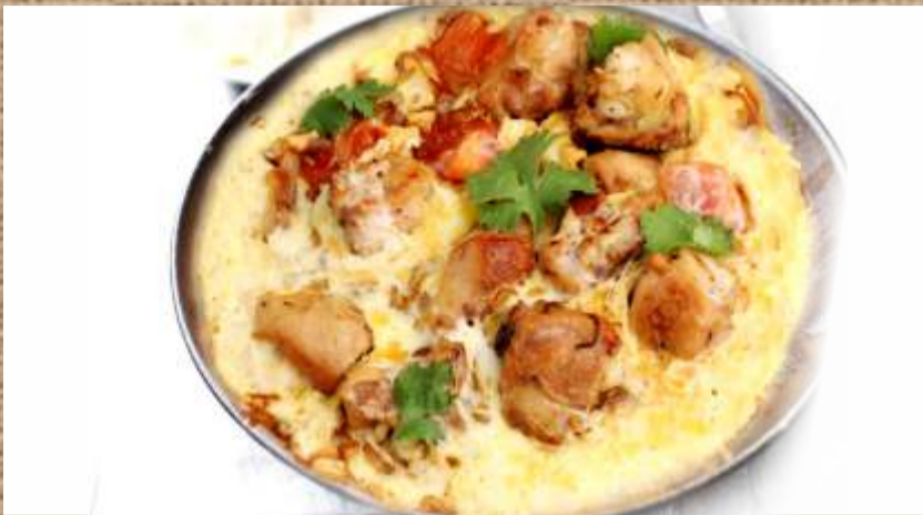
Чыгиртма из куриного филе Chigirtma with chicken fillet