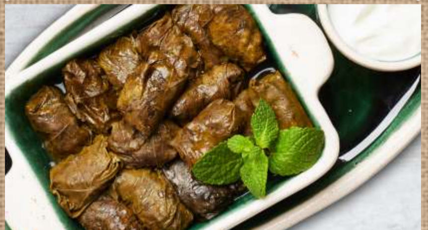
Долма Dolma (stuffed grape leaves rolls with minced meat and rice)