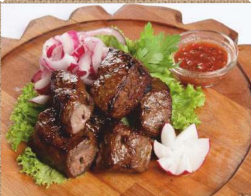
Шашлык из говяжьей печени