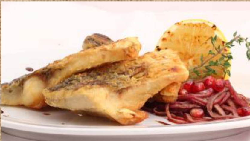
Карп на мангале по-грузински Carp on the grill in Georgian