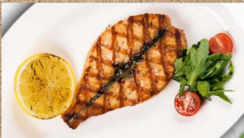
Стейк лосося Salmon steak