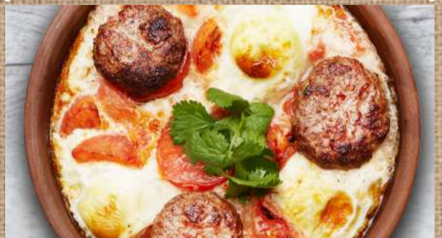
Тава кебаб Tava kebab