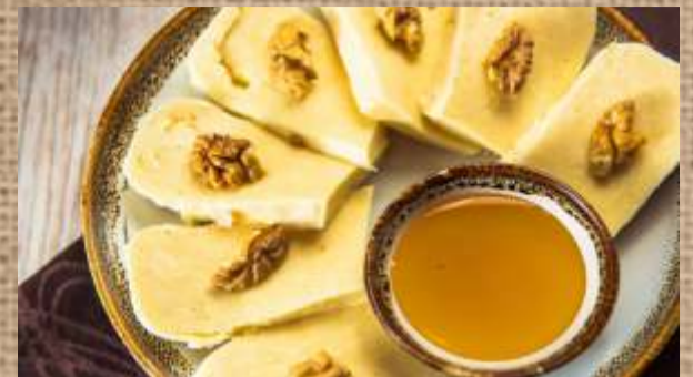
Сыр Сулугуни с медом Suluguni cheese with honey