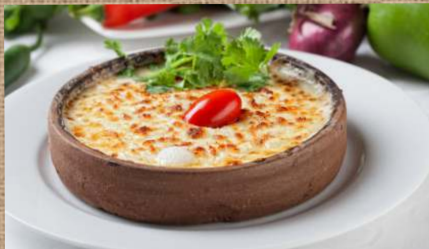
Запеченный сыр Сулугуни