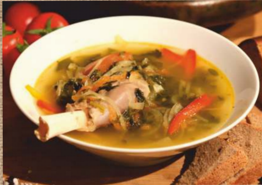
Буглама с овощами голень ягненка с овощами Buglama with vegetables