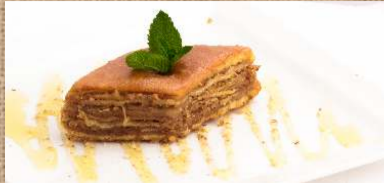
Пахлава с грецким орехом и карамельным соусом Baklava