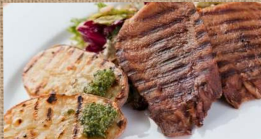
Говяжий язык на мангале с картофелем на углях

Beef tongue on the grill with potatoes on the coals