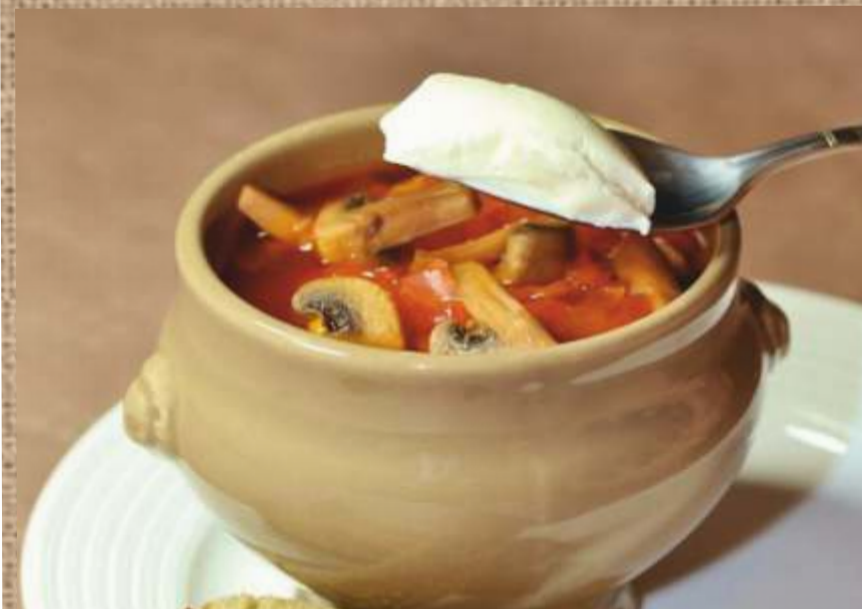
Борщ домашний с грибами Home made Borsch with mushrooms