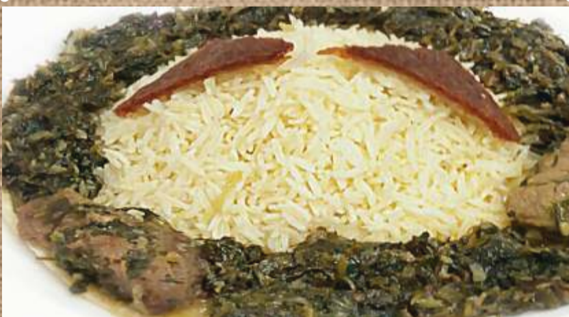
Сабзи плов с телятиной Sabzi pilaf with veal (pilaf with green stuff and veal)