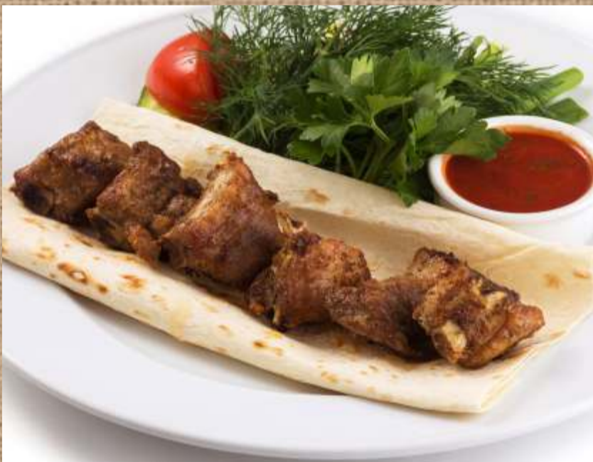
Шашлык «телячьи ребрышки»