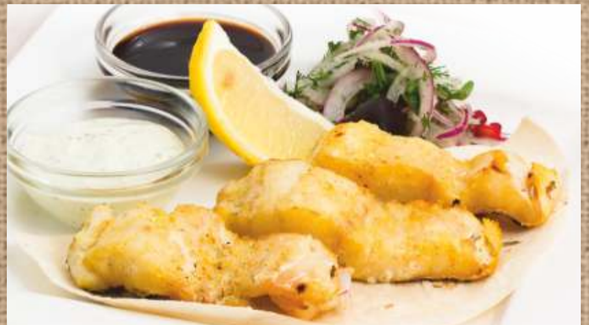
Шашлык из филе судака Zander fillet Shashlik