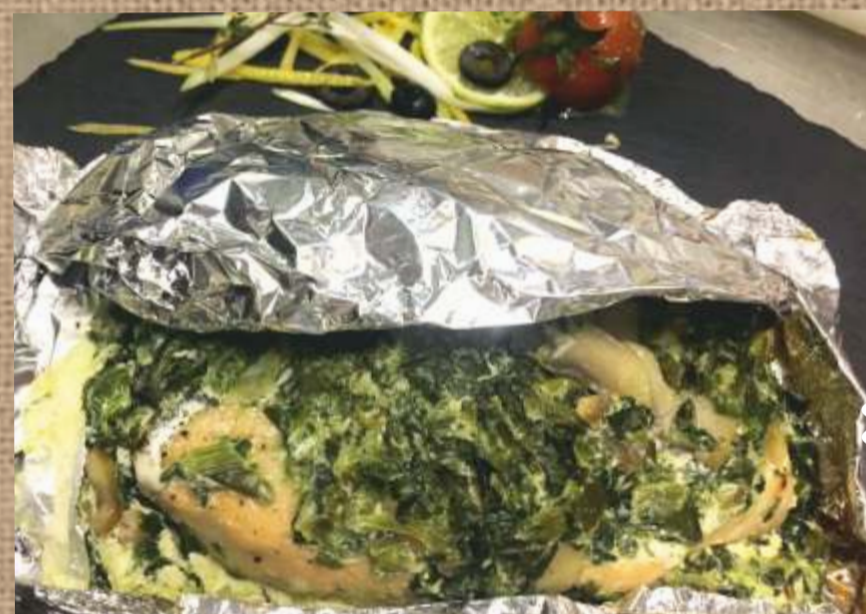
Филе судака со шпинатом в фольге