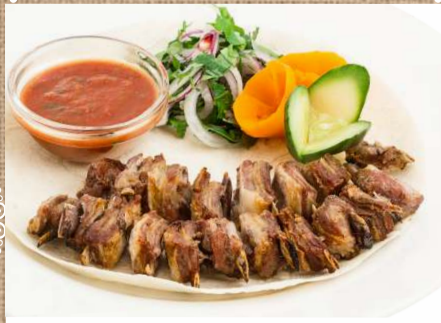
Шашлык «ребрышки ягненка» "Lamb ribs" Shashlik 250гр. 340 P