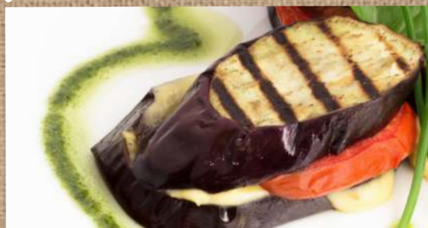
Баклажаны на гриле с сыром сулугуни и соусом Песто

Grilled eggplants with Suluguni cheese & Pesto sauce