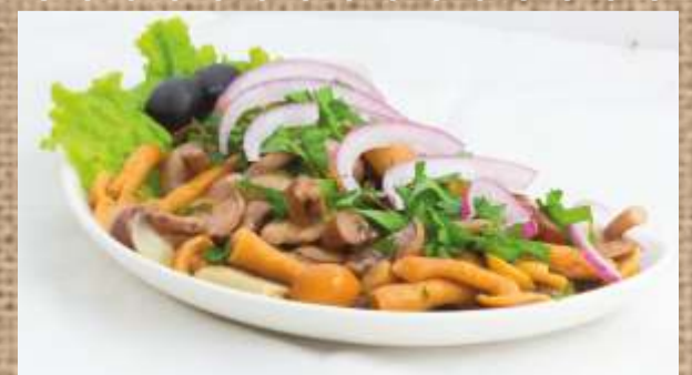
Ассорти из маринованных грибов Assorted Pickled Mushrooms