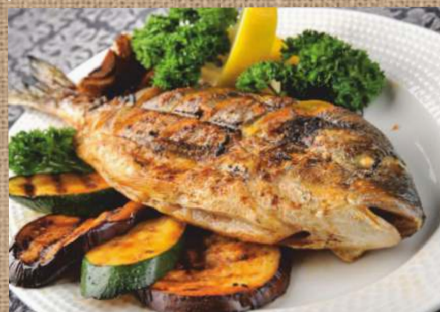
Дорадо с овощами гриль