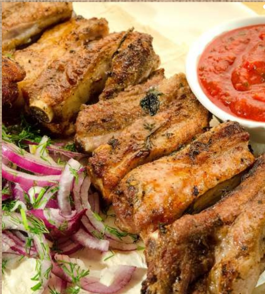
Свинина на ребре Spare ribs shashlik