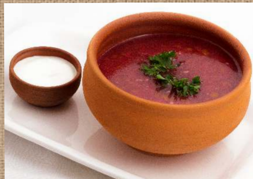
Борщ домашний подается со сметаной Home made Borsch (Russian beetroot soup)