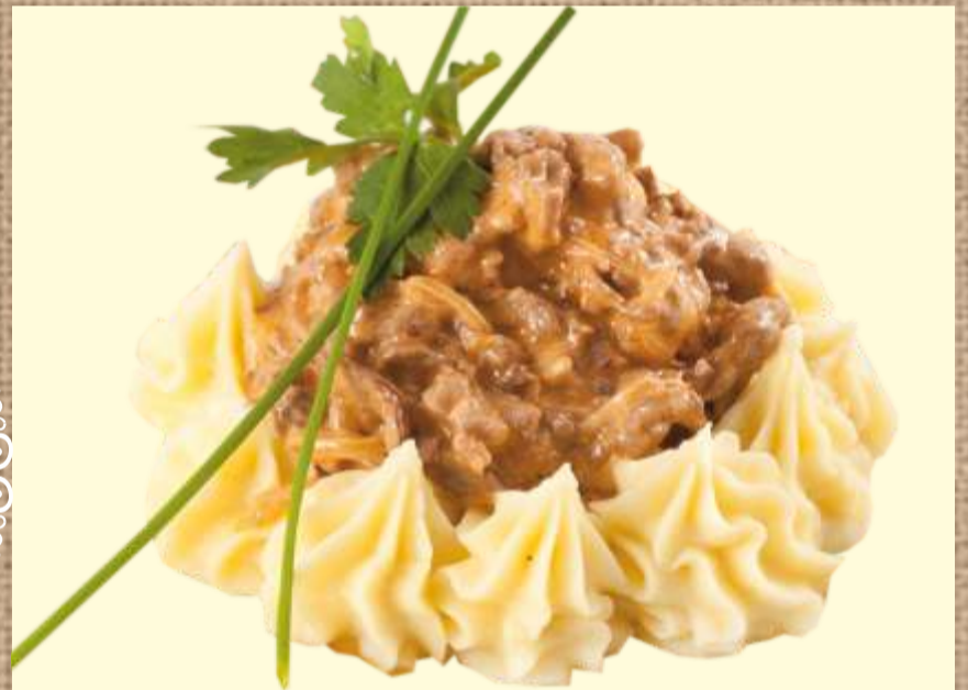
Бефстроганов из говяжьей вырезки с грибами и картофельным пюре 390 P Beef stroganoff from beef tenderloin with mushrooms and mashed potatoes 150/160гр.