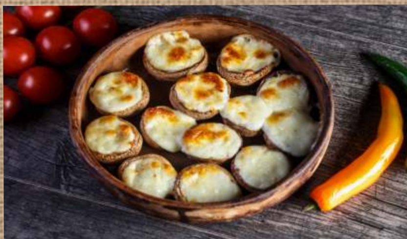
Шампиньоны, запеченные с сыром