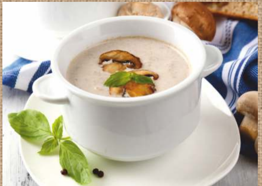
Крем-суп грибной Mushroom Cream-Soup