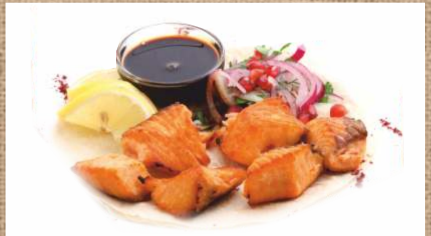
Шашлык из лосося Salmon Shashlik