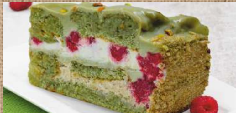
Фисташковый торт Pistachio cake