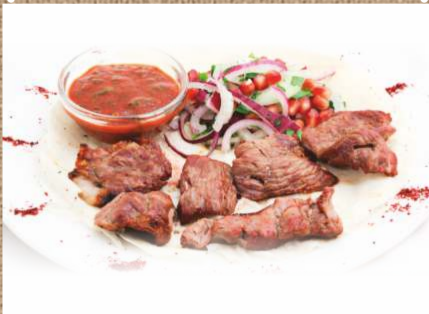
Шашлык из мякоти ягненка Lamb Shashlik 200/30гр. 490 P