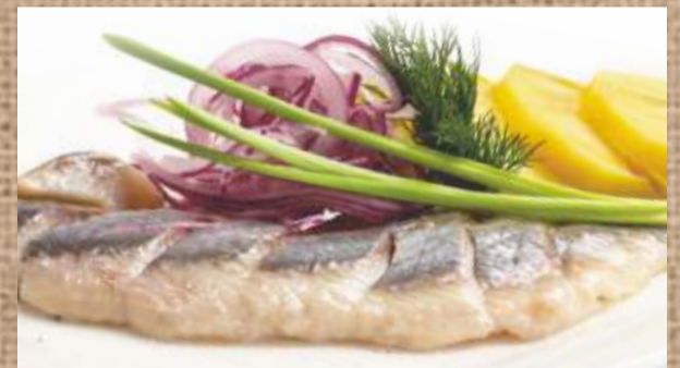
Филе сельди Herring fillet