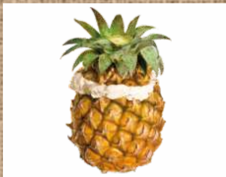
Мороженое в ананасе Ice Cream in Pineapple