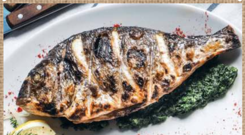
Дорато на мангале со шпинатом Dorado on the grill with spinach