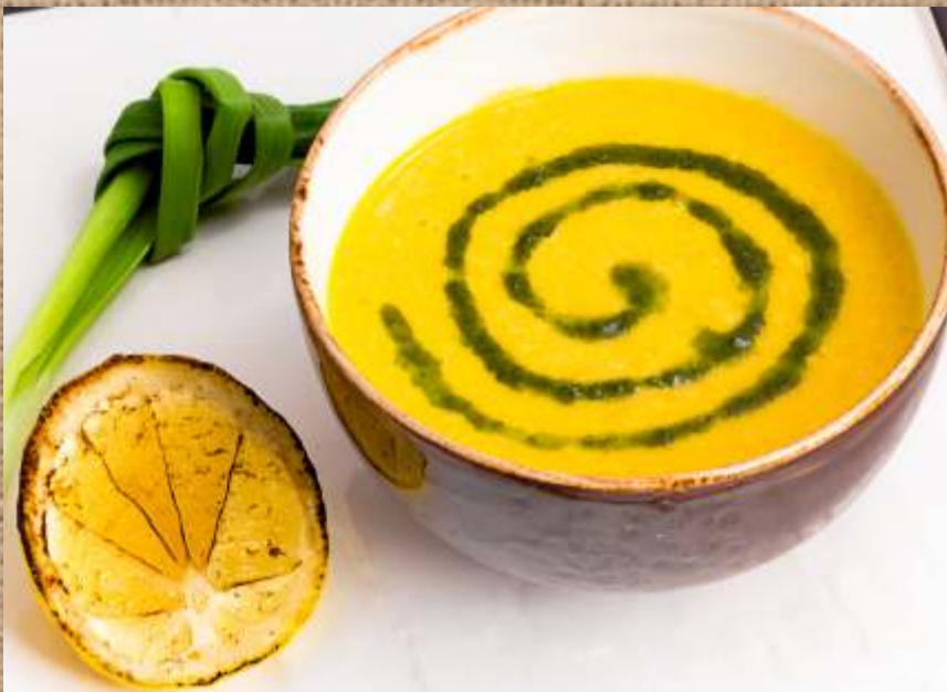
Крем-суп из лосося с соусом песто Salmon cream soup with pesto sauce