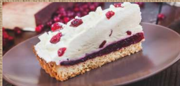
Брусничный пирог с белым шоколадом Lingonberry cake