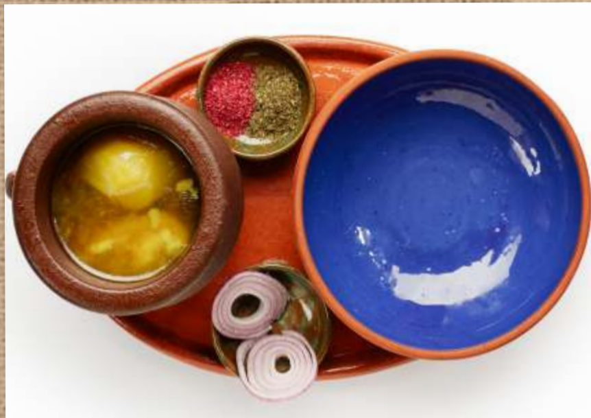
Пити из баранины суп из ягненка, нута и картофеля Piti with mutton