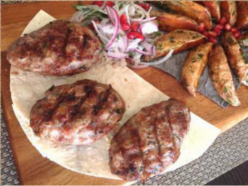
Котлеты микс с картофелем по-деревенски 340 P Mixed rissoles with country-style potatoes 180/100/30гр.