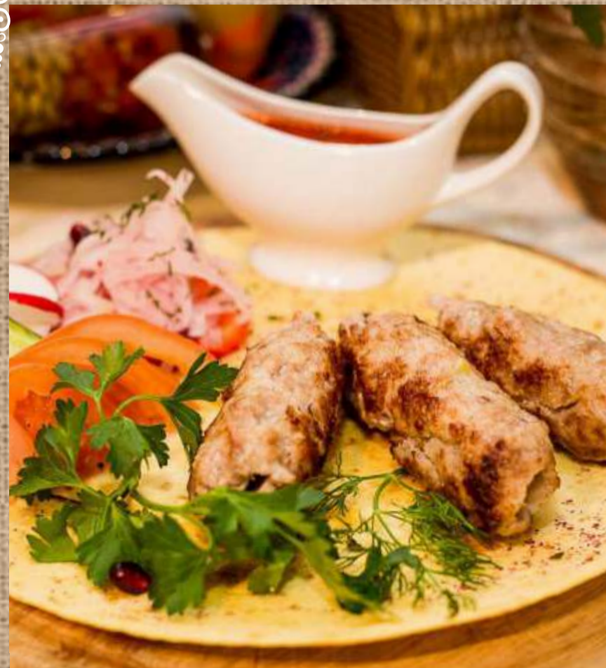
Люля-кебаб из свинины Pork lulya-kebab