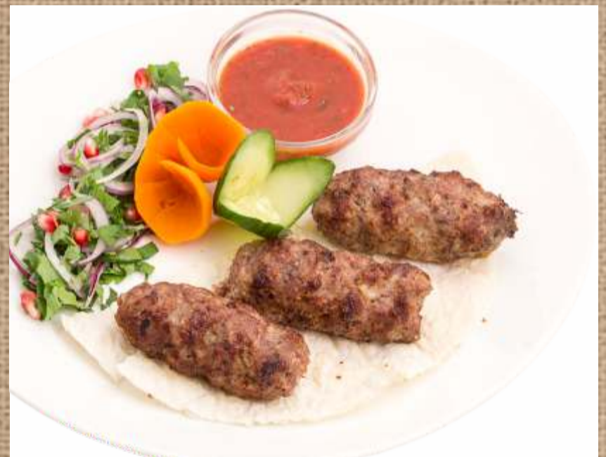
Люля-кебаб из телятины