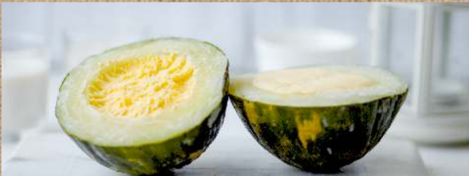
Мороженое в дыне Ice Cream in melon