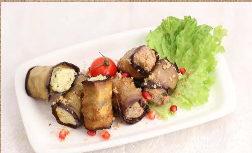
Баклажаны по-хански рулеты из обжаренных баклажанов с сырной начинкой из грецкого ореха Stuffed eggplant rolls