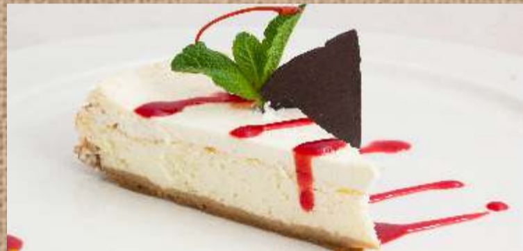
Чизкейк «New York» Cheesecake «New York»