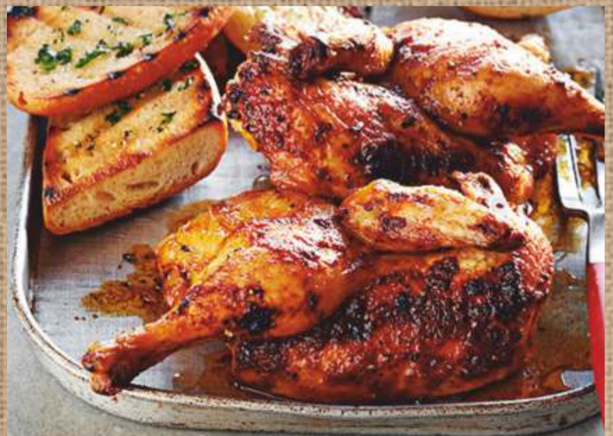
Цыпленок по-гальски 390 P подается с картофелем по-деревенски и соусом Ткемали Baked chicken with potatoes 300/150/30гр.