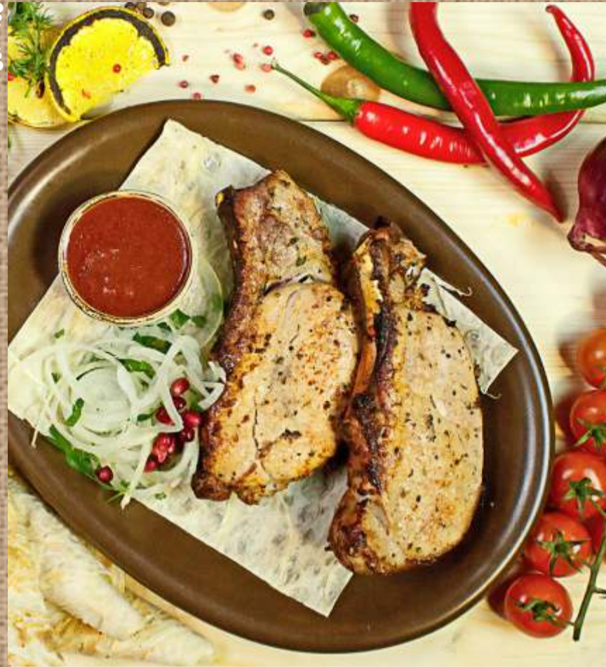
Шашлык из свиной корейки Pork loin shashlik