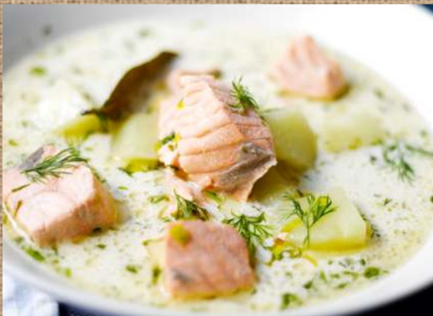
Уха по-фински на сливках Fish soup in Finnish with cream