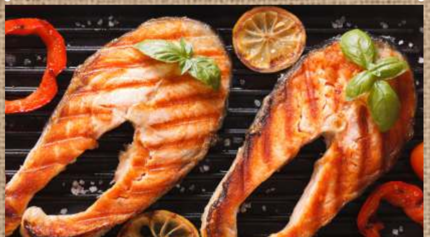
Шашлык из форели Trout Shashlik