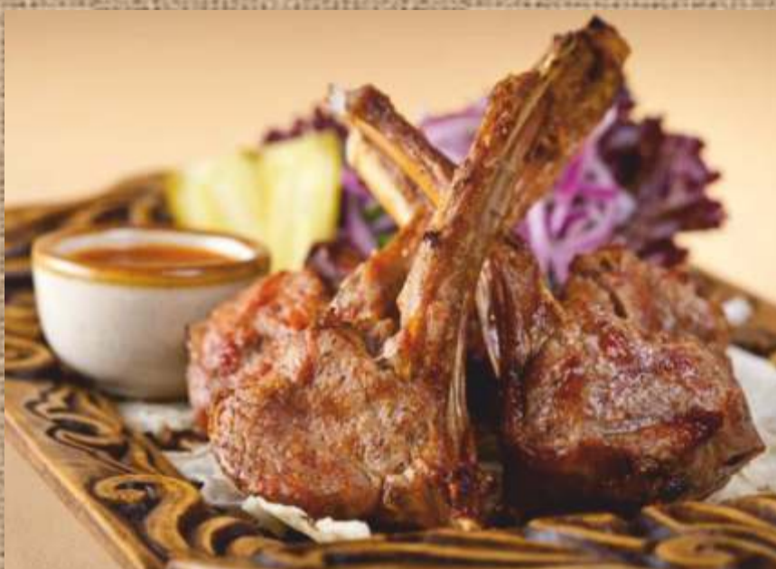
Шашлык по-азербайджански (каре ягненка) Rack of lamb 220гр. 510 P