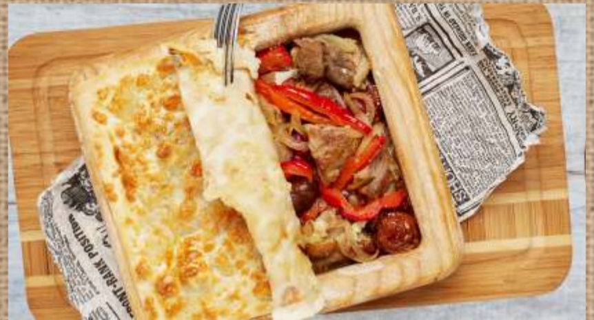
Авторская Говурма телятина 520 P курица 390 P Author's Govurma veal 400гр. chicken 400гр.