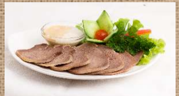
Телячий отварной язык Boiled veal tongue