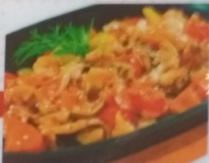
СЕФУДО-ЯСАЙ ТЭЛПАН ЯКИ 360р. жареные морепродукты с овощами, 250г