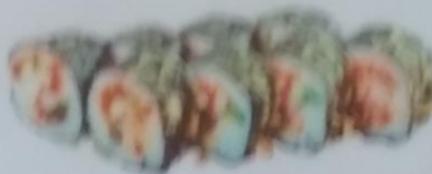
NIZHI MAKI тёплый ролл с лососем, сливочным майонезом, сливочным соусом, икрой tobiko, майонезом, 200г 340р.