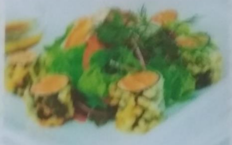
СЫРЕ САРАДА 360р. с сыром чеддер и помидорами в темпуре, 160г