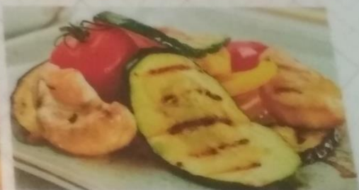
ОВОЩИ ГРИЛЬ , 200г 285р.