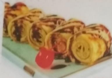
РОЛЛ ОРЕХОВЫЙ, 170г РОЛЛ ФРУКТОВЫЙ, 240г РОЛЛ С БАНАНОМ, 190г