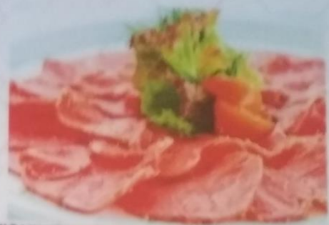
ГЮУНИКУ ТАТАКИ 350р. с тонкими ломтиками мраморной говядины в соусе авокадо, 130г