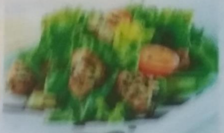
НАГУВО АКАШИ САРАДА 360р. с курицей, помидорами, салатом и соусом, 170г