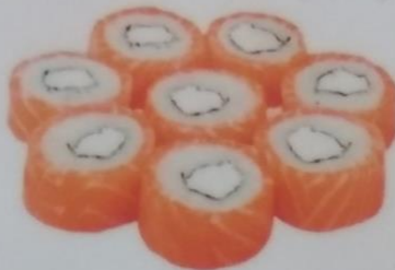
ФИЛАДЕЛЬФИЯ ЛЮКС МАКИ с лососем, сливочным сыром, 230г