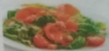
САЛАТ «ЦЕЗАРЬ» С ЛОСОСЕМ 360р. Сыр пармезан, помидоры черри, пармезановый сыр, сыр итальянский, 250г