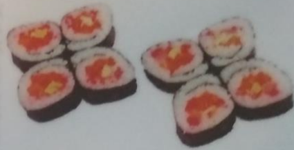
КАНО МАКИ с лососем, морским гребешком, авокадо, майонезом, икрой тобики, 240г