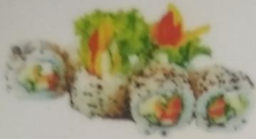
ФИТНЕС МАКИ с болгарским перцем, огурцом, японской капустой, авокадо, 180г