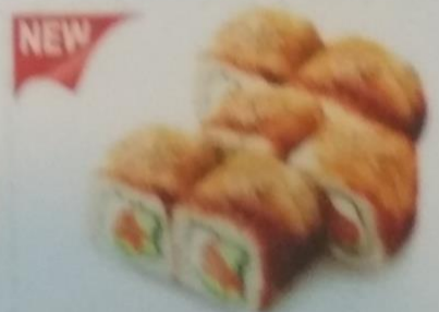
ТАВАЛА МАКИ с угрем, жареным лососем, красной икрой, японским луком, 185г