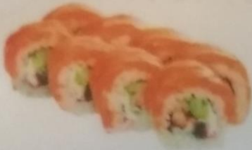
АЙДО МАКИ с лососем, угрем, икрой тобики, огурцом, сливочным сыром, 210г