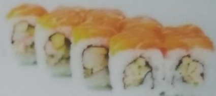
АЛЯСКА МАКИ с лососем, снежным крабом, огурцом, авокадо, майонезом, 240г