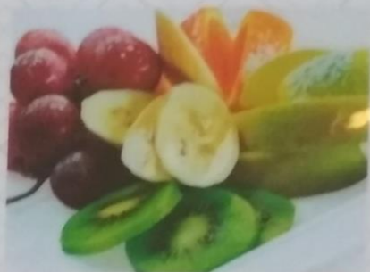
ФРУЦ МОРИВАСЭ, 500г ананас, виноград, яблоко, апельсин