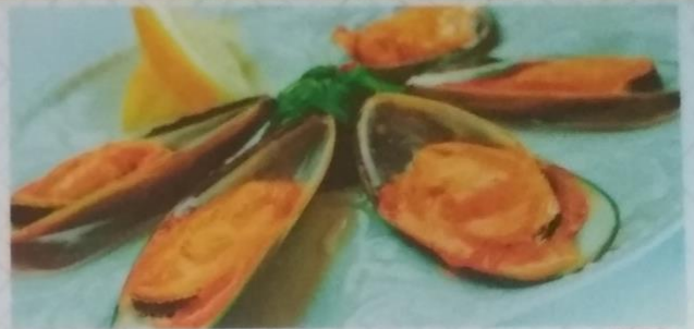
АСАРИ САКА МУСИ мидии запеченные с острым соусом и салатом чука, 170г