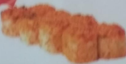
BONG MAKI запеченный ролл с лососем, сливочным майонезом, сливочным соусом, майонезом, сливочным соусом, икрой tobiko, майонезом, 200г 350р.