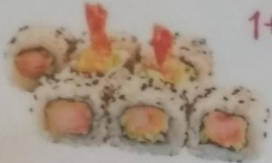
ТЕМПУРА МАКИ с лимонной корочкой, обжаренной в темпуре икровой креветкой, майонезом, 180г