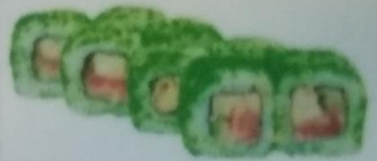
САППОРО МАКИ с фунгом, сливочным сыром, японским омлетом, соусом спайси, икрой тобики, 210г