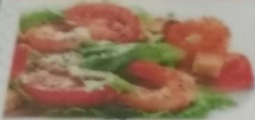
САЛАТ «ЦЕЗАРЬ» С КРЕВЕТКОЙ 380р. Сыр пармезан, помидоры черри, пармезановый сыр, сыр итальянский, 250г