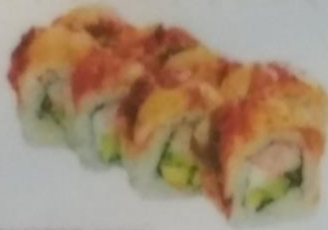
УНАМОТО МАКИ с авокадо, сливочным сыром, угрем, сливочным сыром, 210г