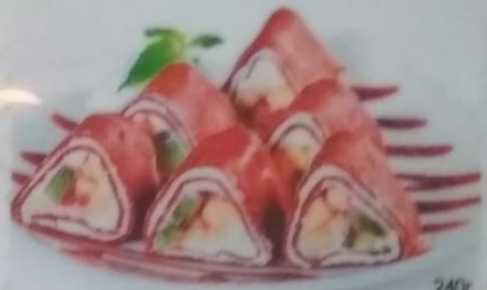
РОЛЛ ШОКОЛАДНЫЙ С ФРУКТАМИ