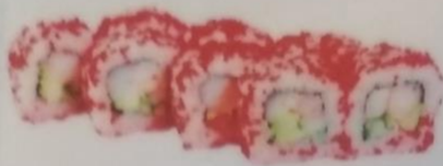
КАЛИФОРНИЯ МАКИ с креветкой, огурцом, авокадо, 190г