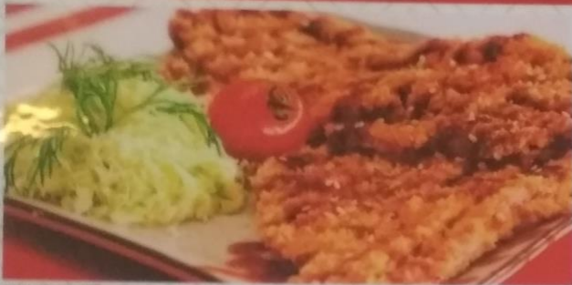
ТОНКАЦУ отбивная из свинины в паннировке с соусом тонкацу, 290г