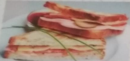
ПОДАЕТСЯ С КАРТОФЕЛЕМ ФРИ 210г 260р.