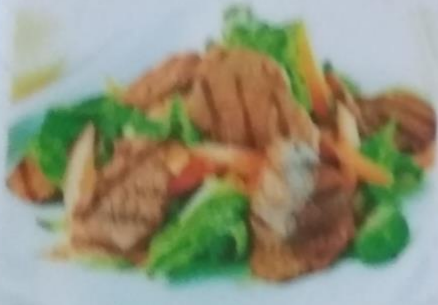
ГЮУНИКУ САРАДА 340р. с курицей и салатом, 170г