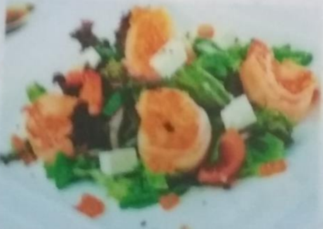
ЭВКУ САРАДА 370р. с курицей, салатом, сыром фета и помидорами, 230г