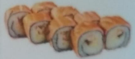
ХЕНД МАКИ с угрем, авокадо, луком, майонезом, в обжаренном лососе, 210г