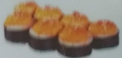
TORIMA MAKI запеченный ролл с лососем, сливочным майонезом, сливочным соусом, майонезом, сливочным соусом, икрой tobiko, майонезом, 200г 340р.