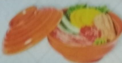
NISEKOBZOU выпеченный торт ролл, икрой tobiko, сливочным майонезом и сливочным соусом, 170г 320р.