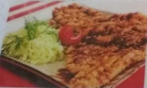
ШНИЦЕЛЬ КУРИНЫЙ 1+1 280р. отбивная из курицы в панировке, пекинской капустой и соусом