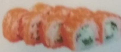
СУВА МАКИ с лососем, огурцом, сыром фетакки, японским луком, 185г