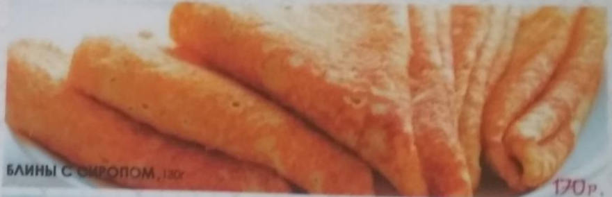
БАНИНЫ С СИРОПОМ, 130г