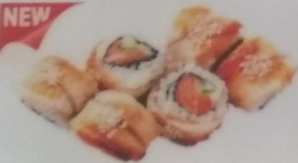
АСАХИ МАКИ с угрем, лососем, сливочным сыром, огурцом, 190г