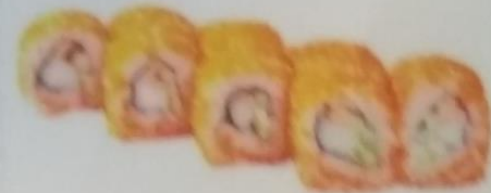
МАРНОКА МАКИ с жареной лососем, сливочным сыром, огурцом, майонезом, японским омлетом, 180г