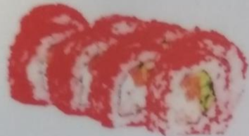
ЯКУДЗА МАКИ с лососем, жареным огуном в темпуре, панчиаром, майонезом, икрой тобики, 190г