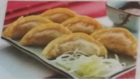
ПЕЛЬМЕНИ ИЗ ГОВЯДИНЫ 1+1 280р. подаем с соевым соусом