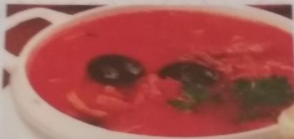
СОЛЯНКА МЯСНАЯ, 250г 190р.