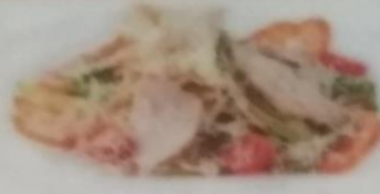
САЛАТ «ЦЕЗАРЬ» С КУРИЦЕЙ 340р. Сыр пармезан, помидоры черри, пармезановый сыр, сыр итальянский, 250г