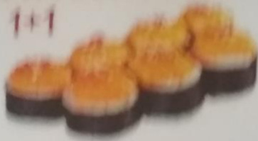
SUNAMI MAKI запеченный ролл с лососем, сливочным майонезом, сливочным соусом, икрой tobiko, майонезом, 200г 380р.