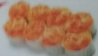
KEB MAKI запеченный ролл с лососем, сливочным майонезом, сливочным соусом, икрой tobiko, майонезом, 200г 340р.