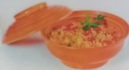
ТЯХАН-ЯСАЙ жареный рис с овощами, 250г