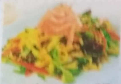
ТОРИ КУНСЕЙ САРАДА 310р. с лососем, сыром чеддер, помидоры, авокадо, салатом и соусом, 210г