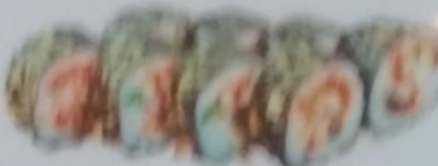
TAYO MAKI тёплый ролл с лососем, сливочным майонезом, сливочным соусом, икрой tobiko, майонезом, 200г 340р.