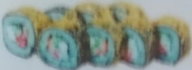
FUJIZHIMA MAKI тёплый ролл с лососем, угрем, икрой tobiko, огурцом, сливочным майонезом, 200г 340р.