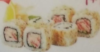
ОТО МАКИ с японским омлетом, снежным крабом, огурцом, кунжутном, соусом цезарь, 180г