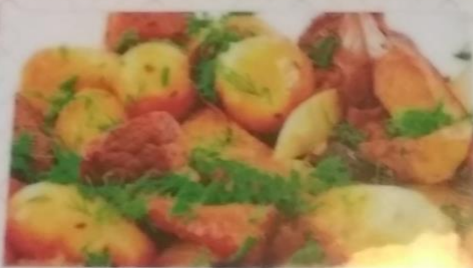
ЖАРКОЕ ПО-ДОМАШНЕМУ 250г 350р.