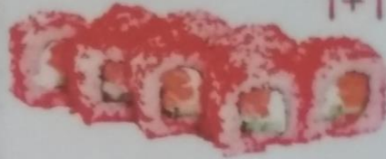
ЭДО МАКИ с лососем, сыром фетаки, огурцом, икрой тобики, 190г