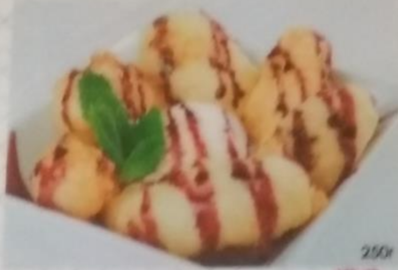
ТЕМПУРА ЯБЛОКО ТЕМПУРА ГРУША ТЕМПУРА БАНАН