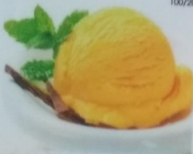
КЛУБНИЧНЫЙ ЛИМОННЫЙ ТРОПИЧЕСКИЙ