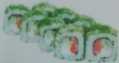
КАТАНА МАКИ с лососем, сливочным сыром, огурцом, укропом, 190г