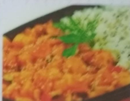
ИКА-НО ГОХАН 360р. обжаренный стейк с овощами и рисом, 300г