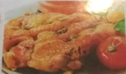
ЖАРЕНОЕ КУРИНОЕ БЕДРО С КАРТОФЕЛЕМ ФРИ , 260г 330р.