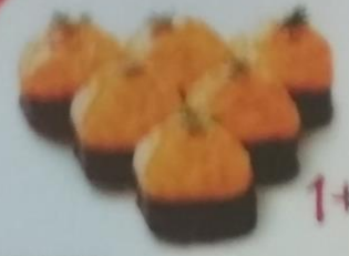
TAYSON MAKI запеченный ролл с филом, сливочным майонезом, сливочным соусом, майонезом, сливочным соусом, икрой tobiko, майонезом, 200г 350р.