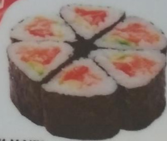
ЮЯКИ МАКИ с лососем, авокадо, такуаном, помидором, майонезом, 190г