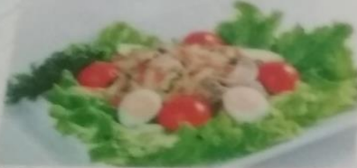
САЛАТ «КАЛАМАРИ» 350р. Кальмар, пармезановый сыр, огурец, красная икра, обжаренные шампиньоны, 250г