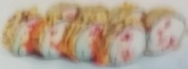
YKOMO MAKI тёплый ролл с лососем, сливочным майонезом, сливочным соусом, икрой tobiko, майонезом, 200г 340р.