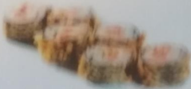
ATARAMA MAKI тёплый ролл с лососем, сливочным майонезом, сливочным соусом, икрой tobiko, майонезом, 200г 350р.