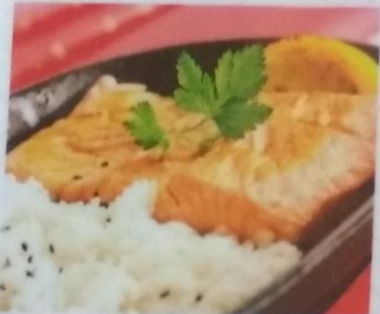
СЯКЕ НО КАБАЯКИ 480р. запеченное филе лосося с рисом, 300г