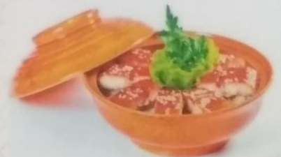
УНАДЗЮ копченый угорь на рисе, 300г