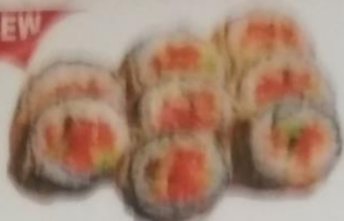
KAMATI MAKI тёплый ролл с угрем, огурцом, икрой tobiko, сливочным майонезом, 200г 380р.