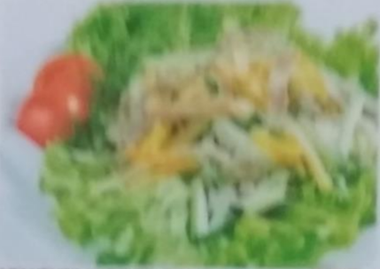
КОУСХТАН САРАДА 270р. с курицей, сыром чеддер, помидоры, салатом, соусом, 170г