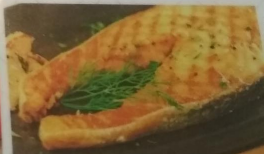
СТЕЙК ЛОСОСЯ , 250г 485р.