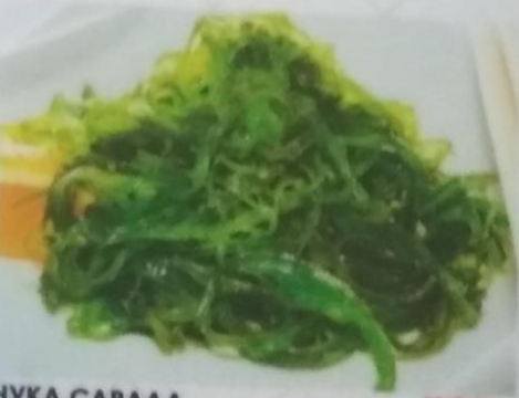
ЧУКА САРАДА 280р. с маринованными водорослями, 150г