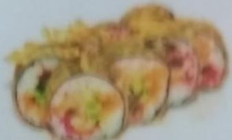
DZINKOKUYO MAKI тёплый ролл с лососем, сливочным майонезом, сливочным соусом, икрой tobiko, майонезом, 200г 350р.