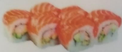
СИНСЮ МАКИ с лососем, креветкой, огурцом, авокадо, соусом тайский, 190г