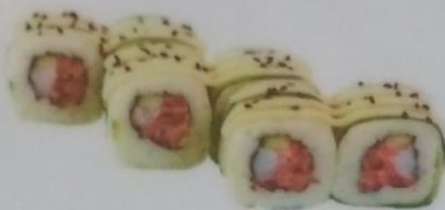
ТЕЙШОКУ МАКИ с говяжьим языком, тигровой креветкой, огурцом, майонезом, 190г