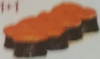
SERRAVAL MAKI запеченный ролл с лососем, сливочным майонезом, сливочным соусом, майонезом, сливочным соусом, икрой tobiko, майонезом, 200г 360р.