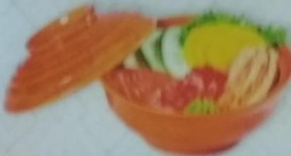
OYKOBZOU выпеченный торт ролл лососем, икрой tobiko, сливочным майонезом и сливочным соусом, 170г 300р.