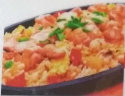
СИНДЗО-ГОХАН 340р. жаренные куриные сердечки с рисом и овощами, 300г