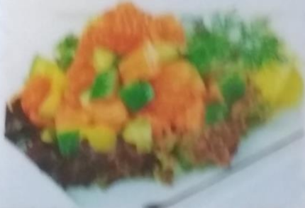
БЕНИ ТОРО ВАСАБИ АЭ 330р. с лососем, сыром чеддер, помидоры, авокадо, салатом и соусом, 200г