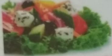
САЛАТ «ГРЕЧЕСКИЙ» 350р. Классический овощной салат, 250г