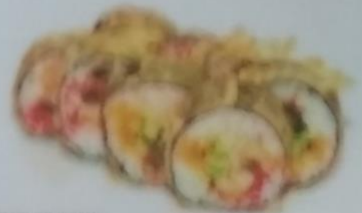
KOTO MAKI тёплый ролл с угрем, сливочным майонезом, сливочным соусом, икрой tobiko, майонезом, 200г 360р.