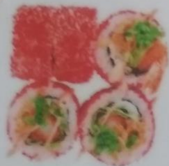
ХАТОРИ МАКИ с филе цыпленка в кляре, японским омлетом, салатом айсберг, икрой тобики, соусом цезарь, 190г