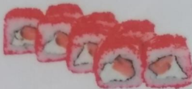
САТОНОНО МАКИ с копченым лососем, сливочным сыром, икрой тобики, 190 г