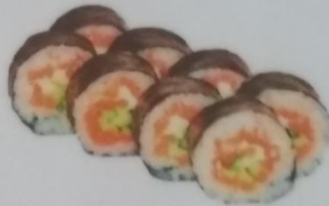
КИОТО МАКИ с огурцом, сливочным сыром, лососем, красной икрой, 230г