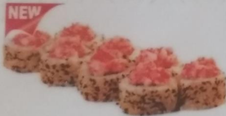
ШИРО МАКИ с тар-таром из семги, сливочным сыром, икрой тобики, огурцом, кунжутом, 200г