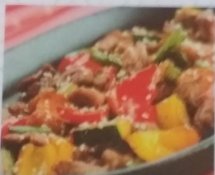
ЁНИКУ ЯСАЙ ТЭЛПАН ЯКИ 420р. жареная баранина с овощами, 250г