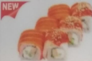
РАДУГА МАКИ с угрем, лососем, сливочным сыром, японским омлетом, кунжутом, огурцом, 180г