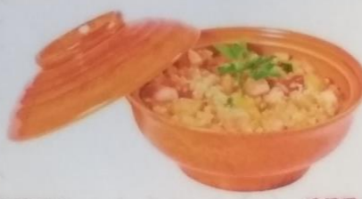
ТЯХАН жареный рис с морепродуктами и овощами, 250г