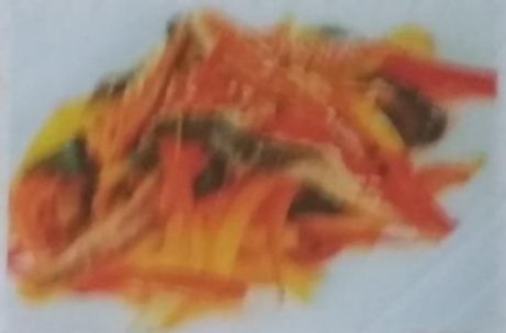
УШАГИ САРАДА 360р. с салатом и соусом, 170г