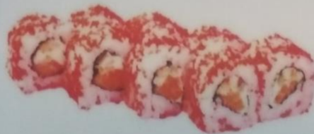
ФИЛАДЕЛЬФИЯ МАКИ ИКРА с лососем, угрем, сливочным сыром, икрой тобики, 190г