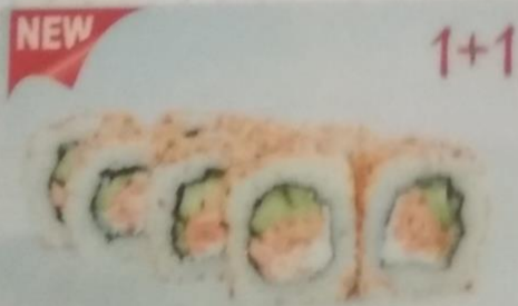
МИЗУМИ МАКИ жареный лосось, сливочный сыр, огурец, кунжут, 190г