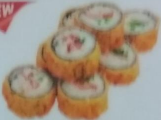
TAXOKU MAKI тёплый ролл с филом, сливочным майонезом, сливочным соусом, майонезом, сливочным соусом, икрой tobiko, майонезом, 200г 350р.