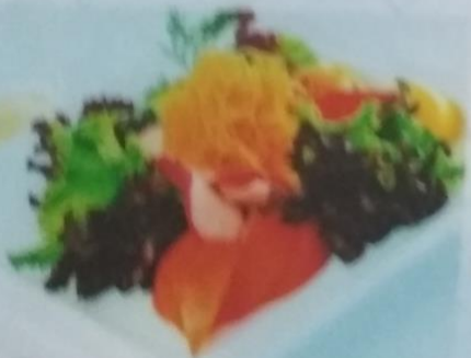
ЯСАЙ САРАДА 280р. с курицей, салатом, помидорами, салатом, соусом, 160г