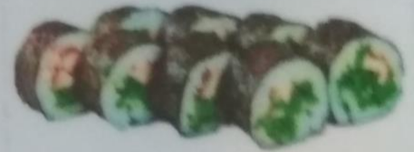
ВАШКИ МАКИ с грибами шиитаке, водорослями чико, молочно-ореховым соусом, 180г