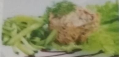
САЛАТ С ТЕЛЯЧИМ ЯЗЫКОМ 330р. Обжаренные грибы, сыр, язык теленочий, 200г