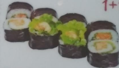
ТСУКИ МАКИ с языком телячим, салатом, икрой масаго, огурцом, соусом цезарь, 190г