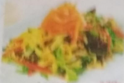
СЫРЕ КУНСЕЙ САРАДА 320р. с сырами чеддер, моцарелла, помидоры, авокадо и соусом, 210г