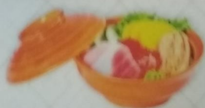
NAMACHIRFASI выпеченный торт ролл лососем, икрой tobiko, сливочным майонезом и сливочным соусом, 170г 360р.