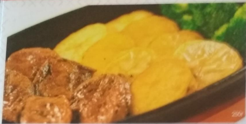
ГОУ ТЭЛПАН ЯКИ 380р. жареная говядина с картошкой и брокколи