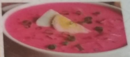
ХОЛОДНЫЙ БОРЩ 250г 170р.