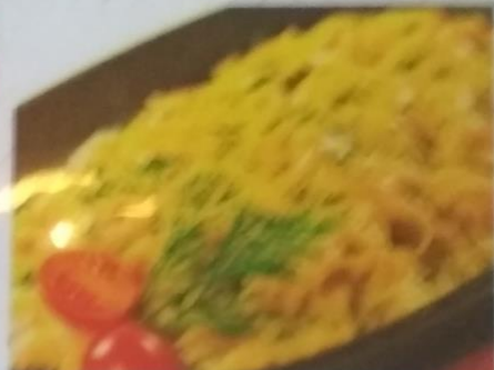
КАЯКУ-ГОХАН 330р. жареная курица с рисом, грибами, капустой и овощами, 300г