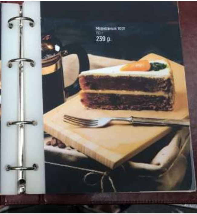
Шоколадный торт 239 р.