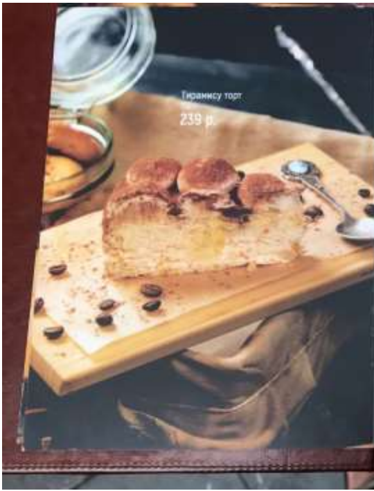
Тирамису торт 239 р.