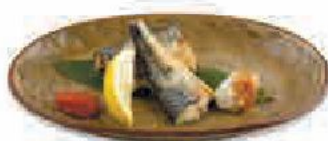
380 ₺ Саба-сиояки Saba-shioyaki さば塩焼き Скумбрия в соли на гриле 200 г