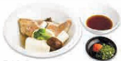
560 ₺ Акаю сакамуси Red bait liquor steamed 赤魚の酒蒸し Красная окунь ликер на пару 220 г