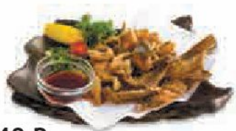
740 ₺ Карей карааге Deep-fried curry カレイ唐揚げ Камбала жареная 250/ 30 г