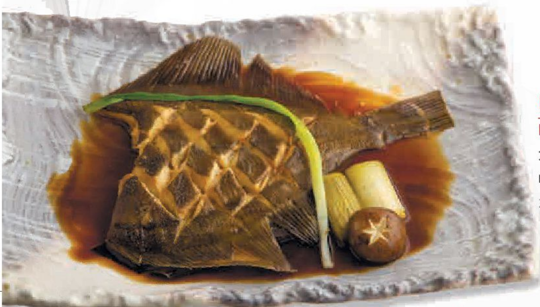
Карей Ницкэ Karei nitsuke カレイ煮付け Варёная камбала в соевом соусе 380 г