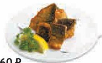
360 ₺ Саба тацутааге Deep-fried mackerel Tatsuta 鯖の竜田揚げ Жареная скумбрия во фритюре 180 г