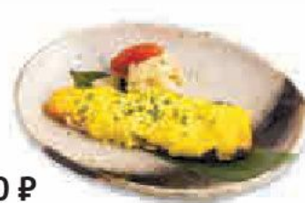
660 ₺ Салмон тамага майонезу Salmon with egg roasted in mayonnaise サーモン 玉子マヨネーズ焼き Жаренный лосось на гриле с яйцом в майонезе 160 г