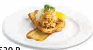
520 ₺ Тара стейк Cod steak 鱈の和風ステーキ Стейк из трески 180 г