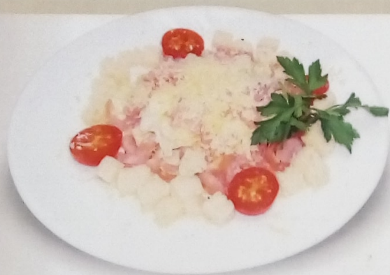
Салат Цезарь с креветками креветки, салат айсберг, соус Цезарь, сыр Пармезан, сухарики