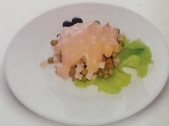
Салат Оливье Классический

ветчина, отварной картофель, свежий огурец, консерв. огурец, яйцо, зеленый горошек, лист салата, майонез